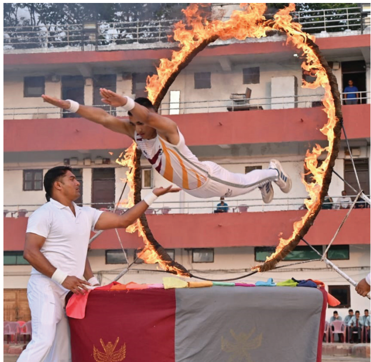
गुरुवार को एनडीए, पुणे के हबीबुल्लाह हॉल में राष्ट्रीय रक्षा अकादमी के 146वें पाठ्यक्रम के दशकौंत्त समारोह के दौरान प्रदर्शित की गई विभिन्न तरह के करतब और कलाबाजियों की एक झलक।