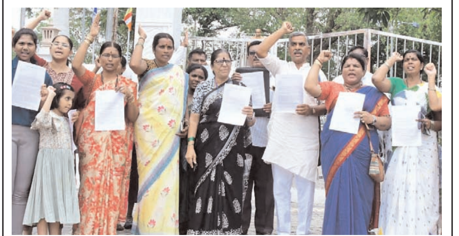
विरोध प्रदर्शन बुधवार को कलबुर्गी में प्रज्वल नागरिक विवेक के सदस्यों ने सांसद प्रज्वल रेवना की गिरफ्तारी की मांग को लेकर विरोध प्रदर्शन किया।

लोकसभा चुनाव की प्रक्रिया पूरी होने के बाद आयोग 11 सीटों पर चुनाव की तैयारियों के बाद इन सीटों को जीतने के लिए कांग्रेस, बीजेपी-जेडीएस के बीच होड़ शुरू हो गई है। विधानसभा की ताकत के आधार पर, सत्तारूढ़ कांग्रेस को 11 में से 7 सीटें जीतने की संभावना है। बाकी चार में से तीन सीटें बीजेपी और एक जेडीएस को आसानी से मिल जाएगी। पिछली बार बीजेपी से डॉ. तेजस्विनी गोड़ा और केपी नंजुडी विधान परिषद सदस्य चुने गए थे। बदले हालात में उन्होंने अपने पदों से इस्तीफा दे दिया और कांग्रेस में शामिल हो गये।