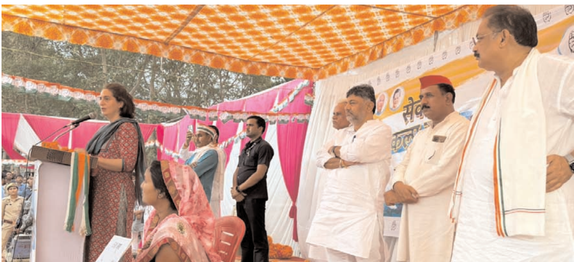
कर्नाटक कांग्रेस के प्रदेशाध्यक्ष एवं उपमुख्यमंत्री डीके शिवकुमार बुधवार को उत्तर प्रदेश के रायबरेली में राहुल गांधी के प्रचार कार्यक्रम में शामिल हुए। इस मौके पर राष्ट्रीय नेता प्रियंका गांधी ने संबोधित किया।