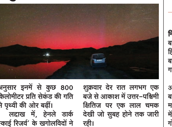
शुक्रवार देर रात लगभग एक बजे से आकाश में उत्तर-पश्चिमी क्षितिज पर एक लाल चमक देखी जो सुबह होने तक जारी रही।

नई दिल्ली/भाषा। सूर्य से पृथ्वी की ओर बड़े सौर चुंबकीय तूफानों के कारण लद्दाख के 'हेनले डार्क स्काई रिजर्व' में आसमान गहरे लाल रंग की चमक से रोशन हो गया। 'सेंटर आफ एक्सिलेंस इन स्पेस साइंसेज इन इंडिया' (सीईएसएसआई), कोलकाता के वैज्ञानिकों के अनुसार, सौर तूफान सूर्य के एआर13664 क्षेत्र से निकलते हैं, जहां से पूर्व में कई उच्च ऊर्जा सौर ज्वालान् उत्पन्न हुई हैं। वैज्ञानिकों के