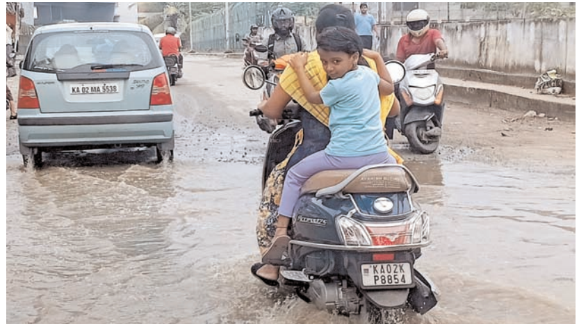
शनिवार को मातृ दिवस के पूर्व बेंगलूरु के पट्टनगरे में बारिश के पानी से पार करते हुए स्कूटर पर मां और बेटी।