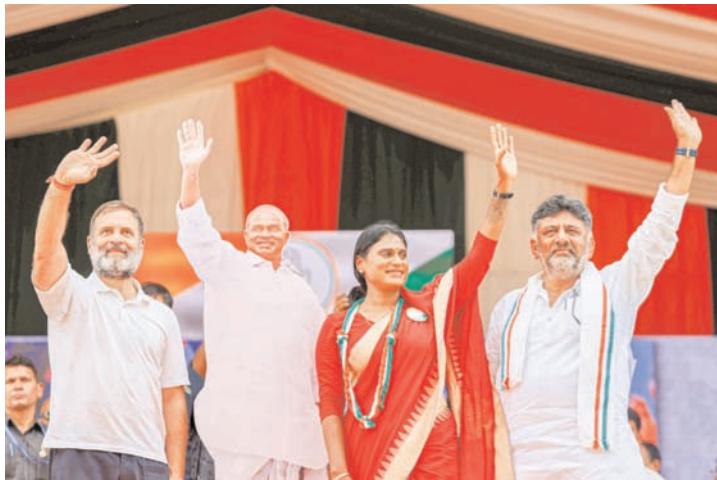
शनिवार को आंध्र प्रदेश के कडप्पा में आयोजित चुनाव प्रचार सभा में कांग्रेस के राष्ट्रीय अध्यक्ष राहुल गांधी, कर्नाटक प्रदेश कांग्रेस अध्यक्ष एवं उपमुख्यमंत्री डीके शिवकुमार, एपीसीसी अध्यक्ष शर्मिला ने हिस्सा लिया। खास बात यह रही कि आंध्र प्रदेश के पूर्व मुख्यमंत्री शर्मिला के पिता स्वर्गीय राजशेखर रेड्डी मंच पर लहराता हुआ कटआउट लेकर आए।