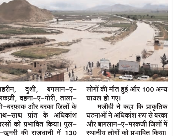
नाहरीन, दुशी, बगलान-ए-मरकजी, वहना-ए-गोरी, ताला-ओ-बरफाक और बरका जिलों के साथ-साथ प्रांत के अधिकांश हिस्सों को प्रभावित किया। पुल-ए-खुमरी की राजधानी में 130

लोगों की मौत हुई और 100 अन्य घायल हो गए। मजीदी ने कहा कि प्राकृतिक घटनाओं ने अधिकांश रूप से बरका और बगलान-ए-मरकजी जिलों में स्थानीय लोगों को प्रभावित किया।