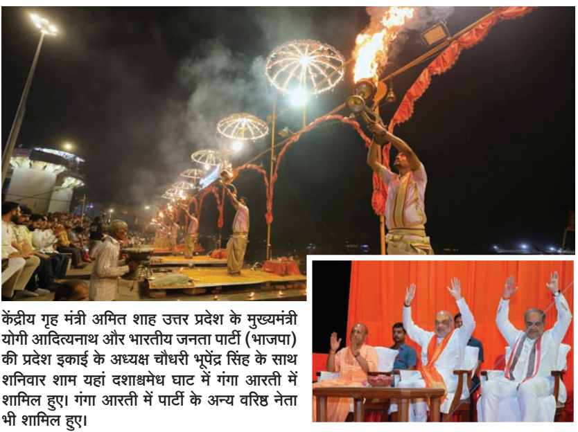
केंद्रीय गृह मंत्री अमित शाह उत्तर प्रदेश के मुख्यमंत्री योगी आदित्यनाथ और भारतीय जनता पार्टी (भाजपा) की प्रदेश इकाई के अध्यक्ष चौधरी भूपेंद्र सिंह के साथ शनिवार शाम यहां दशकामेघ घाट में गंगा आरती में शामिल हुए। गंगा आरती में पार्टी के अन्य वरिष्ठ नेता भी शामिल हुए।