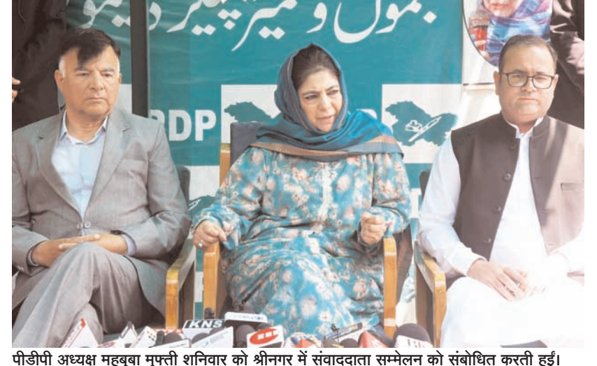
पीडीपी अध्यक्ष महबूबा मुफ्ती शनिवार को श्रीनगर में संवाददाता सम्मेलन को संबोधित करती हुईं।