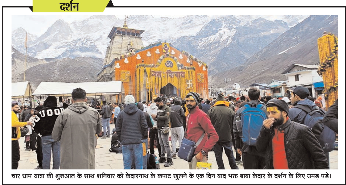
चार धाम यात्रा की शुरुआत के साथ शनिवार को केदारनाथ के कपाट खुलने के एक दिन बाद भक्त बाबा केदार के दर्शन के लिए उमड़ पड़े।