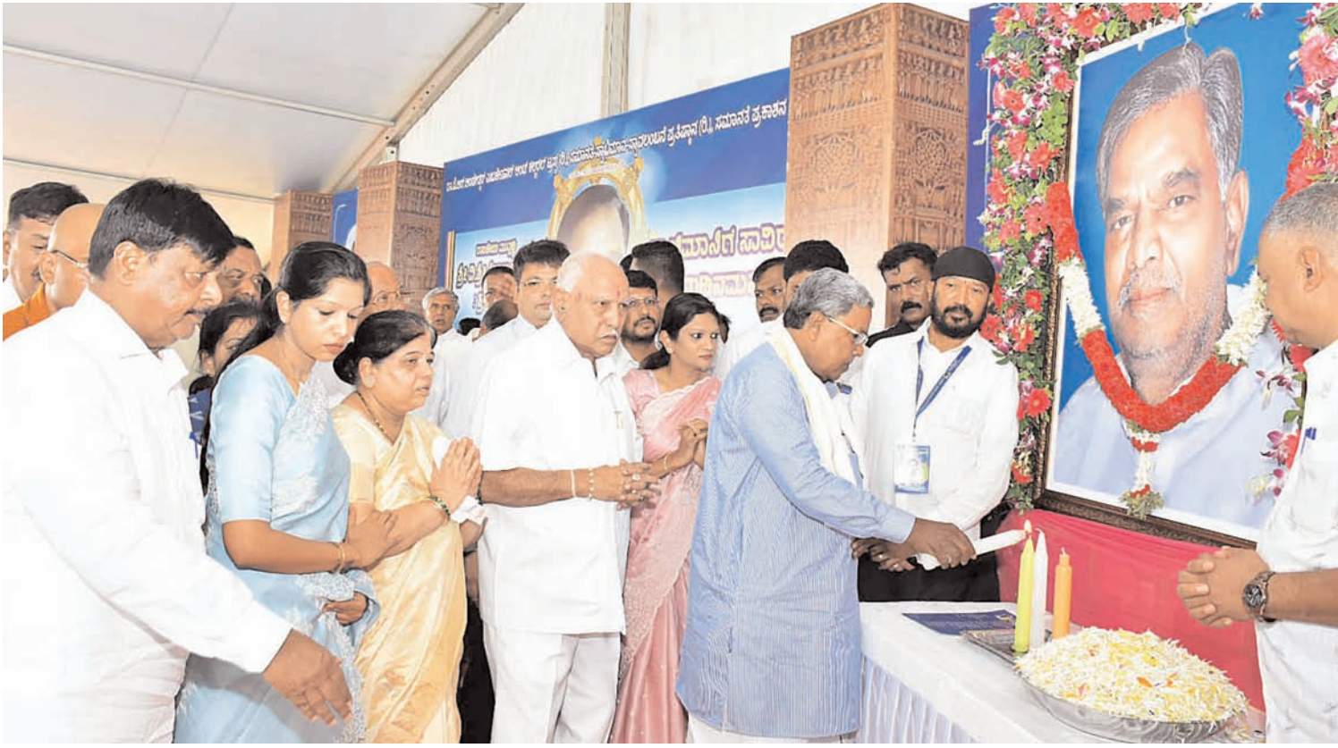
शनिवार को मैसूरु में स्वर्गीय वी श्रीनिवास प्रसाद के लिए स्मृति में आयोजित एक सभा में मुख्यमंत्री सिद्धरामैया एवं पूर्व मुख्यमंत्री बीएस येडीयुरप्पा एवं अन्य पुष्पांजलि अर्पित करते हुए।