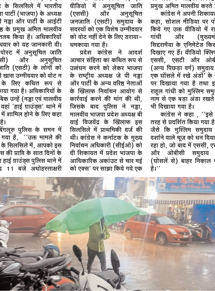
बुधवार को शाम में बेंगलूर में अच्छी बारिश सभी जगह आई। शहर के आरआर नगर में हुई बारिश का एक दृश्य।

कांग्रेस ने कहा, "इसे इस तरह से प्रदर्शित किया गया है कि जैसे कि मुस्लिम समुदाय को दर्शाने वाले चूज को धन दिया जा रहा हो, जो बाद में एससी, एसटी और ओबीसी समुदाय को (घोसलें से) बाहर निकाल देता है।"