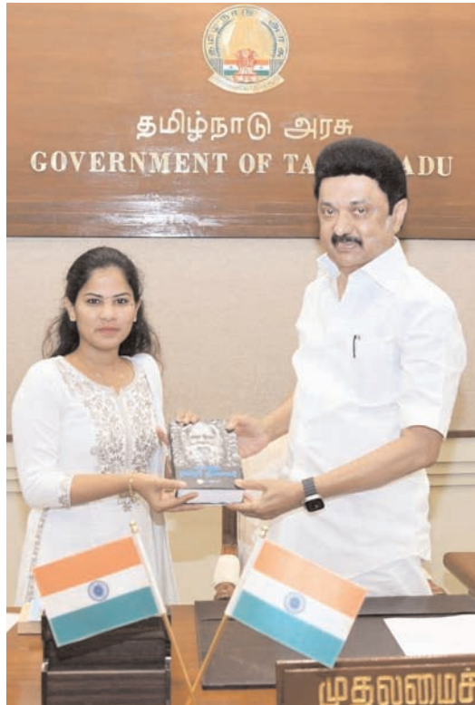
चेन्नई में बुधवार को चेन्नई ग्रेटर कॉर्पोरेशन की मेयर प्रिया रंजन ने मुख्यमंत्री एमके स्टालिन से मुलाकात की।