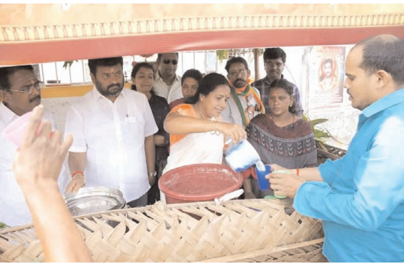
अग्नि नक्षत्र में पड़ने वाली तेज गर्मी से लोगों को राहत दिलाने के लिए कोयंबटूर में जगह जगह पर छाछ केन्द्र और डंडे फल आदि के केन्द्र खोले जा रहे हैं। ऐसे ही एक केन्द्र पर छाछ का वितरण करती हुई भाजपा की राष्ट्रीय महिला अध्यक्ष एवं विधायक वनाथी श्रीनिवासन।