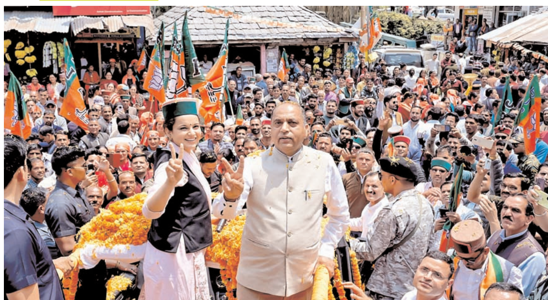
जनसंपर्क यात्रा के दौरान सोमवार को सिराज विधानसभा के खारसी, सलाहर, काण्डा, वाराय्याड, थुनाग में चुनाव प्रचार करती भाजपा प्रत्याशी कंगना रानौत।