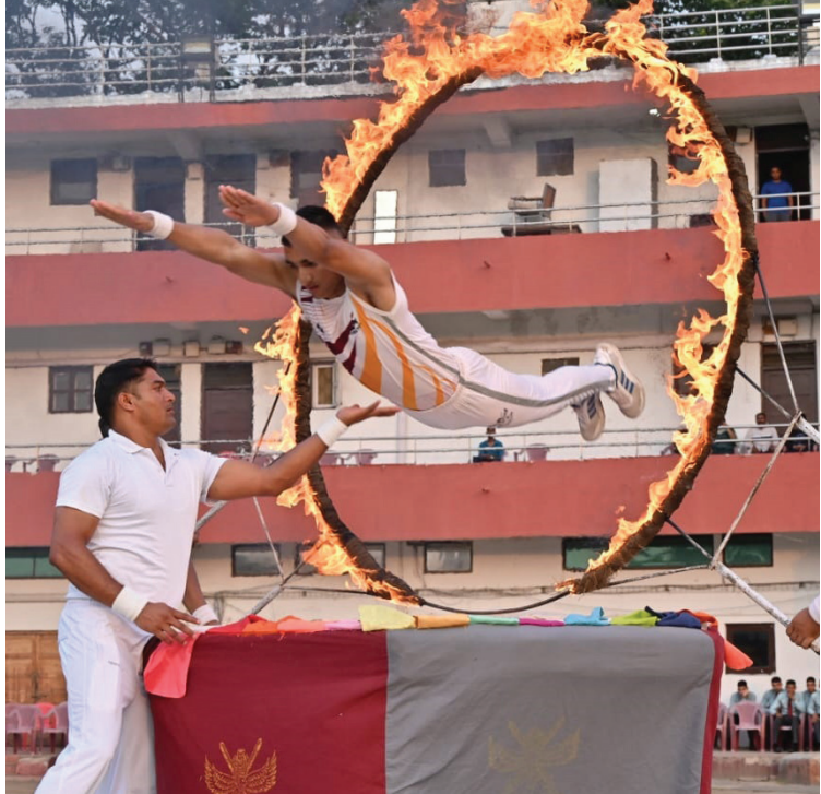
गुरुवार को एनडीए, पुणे के हबीबुल्लाह हॉल में राष्ट्रीय रक्षा अकादमी के 146वें पाठ्यक्रम के दशकौंत्त समारोह के दौरान प्रदर्शित की गई विभिन्न तरह के करतब और कलाबाजियों की एक झलक।