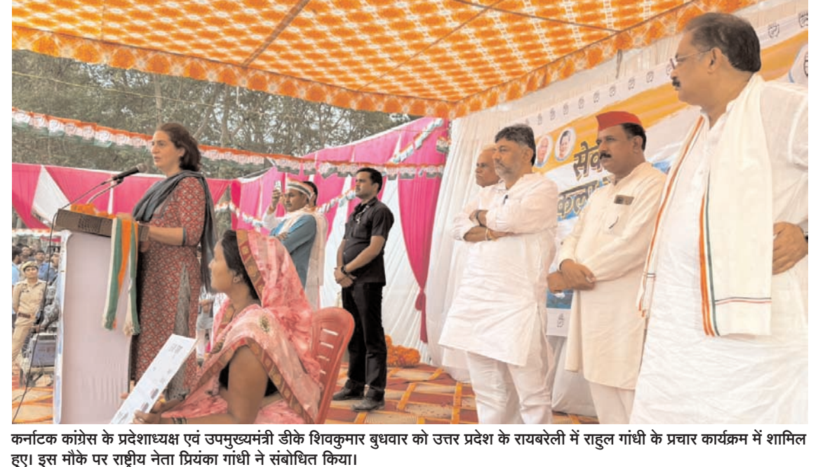
कर्नाटक कांग्रेस के प्रदेशाध्यक्ष एवं उपमुख्यमंत्री डीके शिवकुमार बुधवार को उत्तर प्रदेश के रायबरेली में राहुल गांधी के प्रचार कार्यक्रम में शामिल हुए। इस मौके पर राष्ट्रीय नेता प्रियंका गांधी ने संबोधित किया।