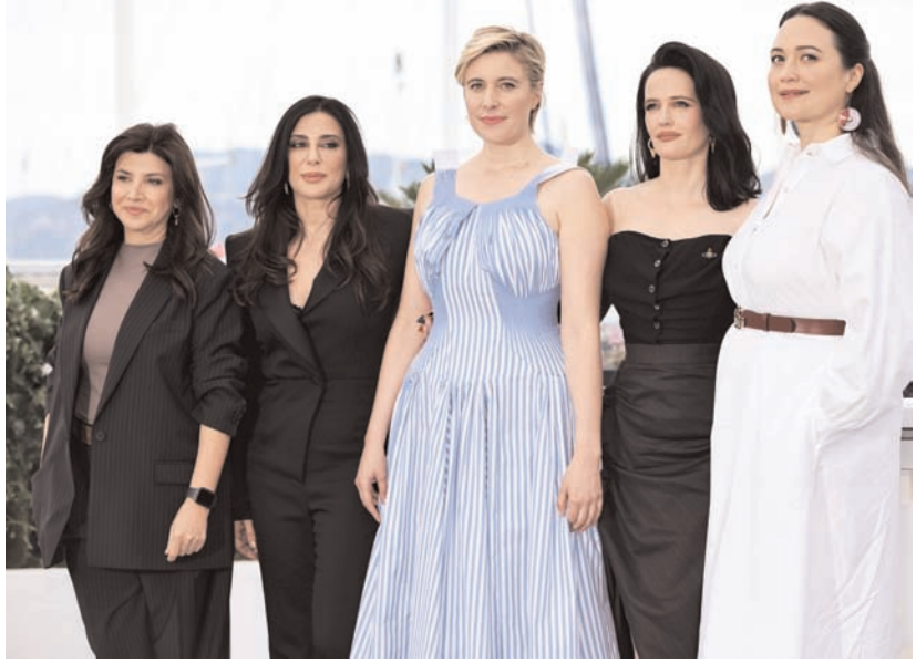
कान्स फिल्म महोत्सव की जूरी अध्यक्ष ग्रेटा गेरविग और जूरी के अन्य सदस्य कान्स में 77वें कान्स फिल्म महोत्सव के उद्घाटन समारोह से पहले एक फोटोकॉल पर पोज देते हुए।