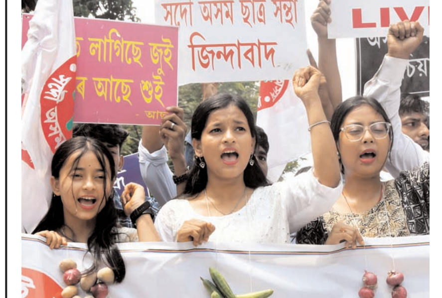
गुवाहाटी में ऑल असम स्टूडेंट्स यूनियन (आरू) ने बुधवार को गुवाहाटी में आवश्यक वस्तुओं की कीमतों में बढ़ोतरी के विरोध में प्रदर्शन के दौरान नारेबाजी की।