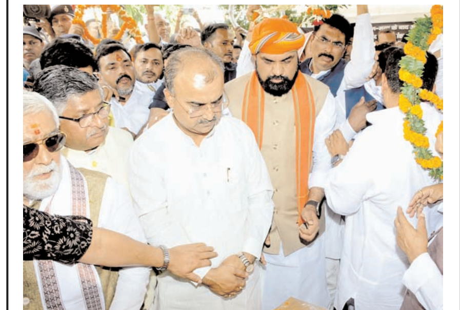
बिहार के उपमुख्यमंत्री और भाजपा के प्रदेश अध्यक्ष सम्राट चौधरी और अन्य लोग भाजपा के वरिष्ठ नेता और बिहार के पूर्व उपमुख्यमंत्री सुशील कुमार मोदी के अंतिम संस्कार में शामिल हुए, जिनका मंगलवार को पटना में निधन हो गया।