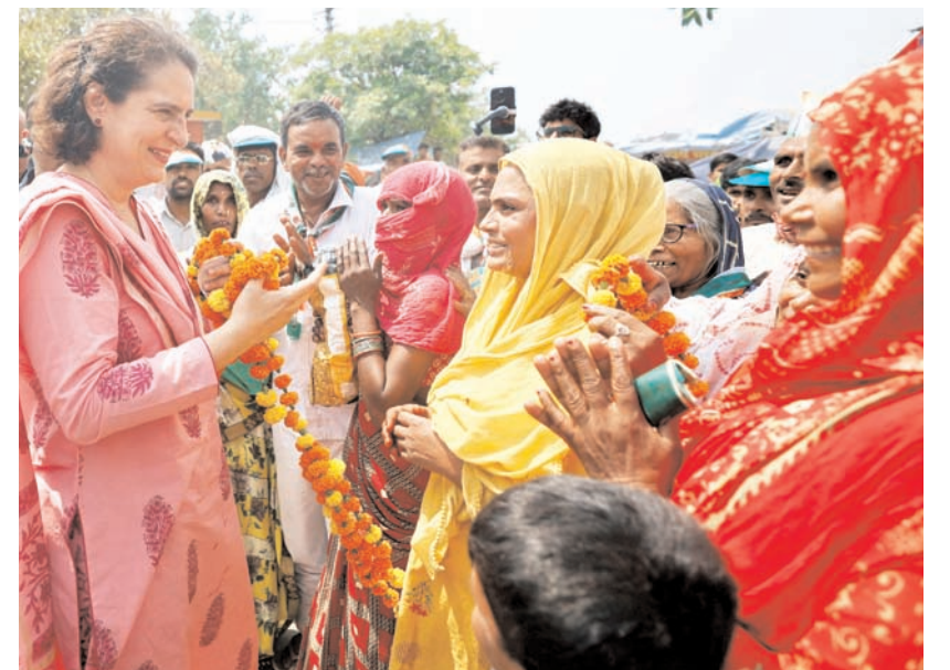
अमेठी में कांग्रेस नेता प्रियंका गांधी मंगलवार को संसदीय चुनाव के लिए पार्टी उम्मीदवार के समर्थन में अपने चुनाव अभियान के दौरान ग्रामीणों से बातचीत करती हुई।