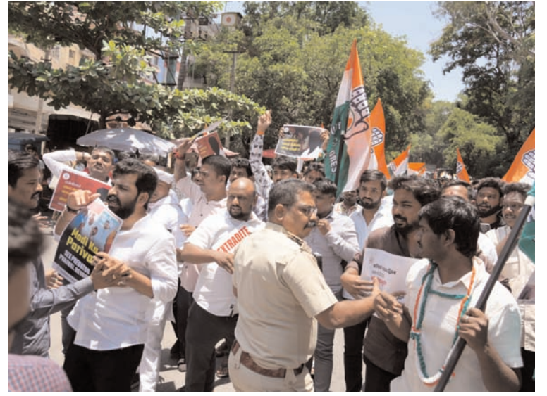
मंगलवार को बंगलूरु के मल्लेश्वरम् स्थित भाजपा के प्रदेशमुख्यालय के समक्ष कांग्रेस कार्यकर्ताओं ने प्रज्वल रेवन्ना की गिरफ्तारी को लेकर विरोध प्रदर्शन किया।