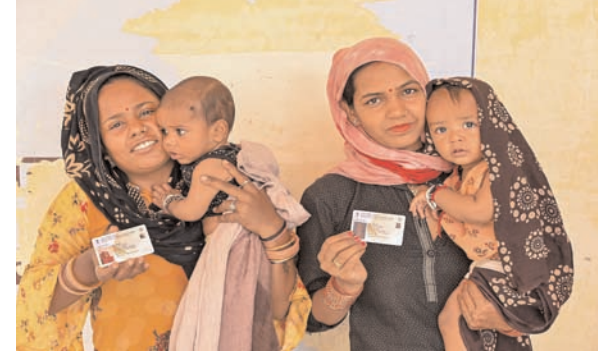
डूंगरपुर के एक पोलिंग बूथ पर हल्दी रस्म के दौरान मतदान करने पहुंची दुल्हन। प्रमाण पत्र देकर सम्मानित किया।