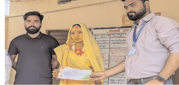
डूंगरपुर के एक पोलिंग बूथ पर हल्दी रस्म के दौरान मतदान करने पहुंची दुल्हन। प्रमाण पत्र देकर सम्मानित किया।

जयपुर/वार्ता राजस्थान के मुख्यमंत्री भजनलाल शर्मा ने शुक्रवार को प्रदेश में लोकसभा चुनाव के दूसरे चरण के तहत 13 सीटों पर शांतिपूर्ण मतदान संपन्न होने पर आमजन का आभार व्यक्त किया है। मतदान संपन्न होने के बाद शर्मा ने कहा कि आज का मतदान यशस्वी प्रधानमंत्री नरेन्द्र मोदी के अद्भुत और मजबूत नेतृत्व में युवाओं, महिलाओं एवं बुजुर्गों के दृढ़ विश्वास को दिखा रहा है। प्रदेश में भारतीय जनता पार्टी (भाजपा) सभी 25 लोकसभा सीटों पर जीत की हैट्रिक का इतिहास बनाएगी। शर्मा ने कहा कि विकसित भारत के सपने को साकार करने के लिए जनता जनार्दन ने अपने मत का सदुपयोग किया है।