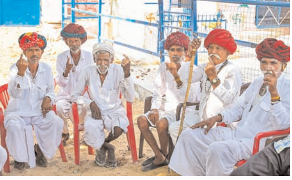
दक्षिण भारत राष्ट्रमत dakshinbharat.com

जयपुर/भाषा राजस्थान की 13 लोकसभा सीट पर दूसरे चरण का मतदान शुक्रवार को शांतिपूर्ण एवं निष्पक्ष संपन्न हो गया। राज्य में दो चरणों में मतदान हुआ है।