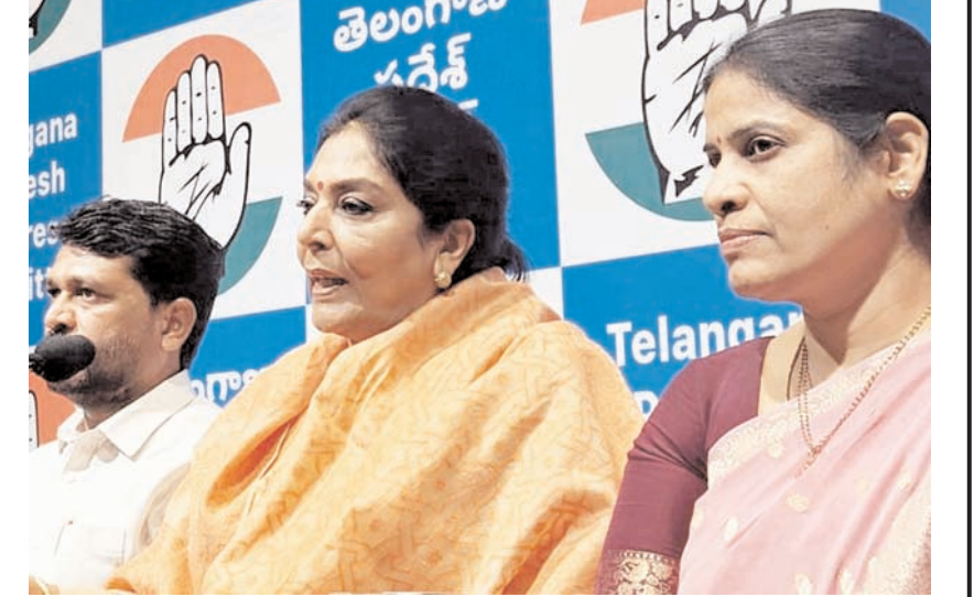
हैदराबाद में पूर्व केंद्रीय मंत्री, सांसद (राज्यसभा) रेणुका चौधरी सोमवार को गांधी भवन में एक संवाददाता सम्मेलन को संबोधित करती हुई।