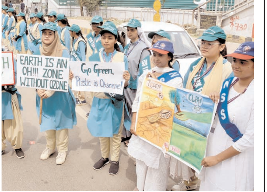
पटना में पृथ्वी दिवस के अवसर पर सोमवार को पाटन महिला कॉलेज की छात्राएं बैनर लिये।