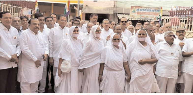
चेन्नई में आवड़ी में प्रवेश के मौके पर अभिनन्दन समारोह