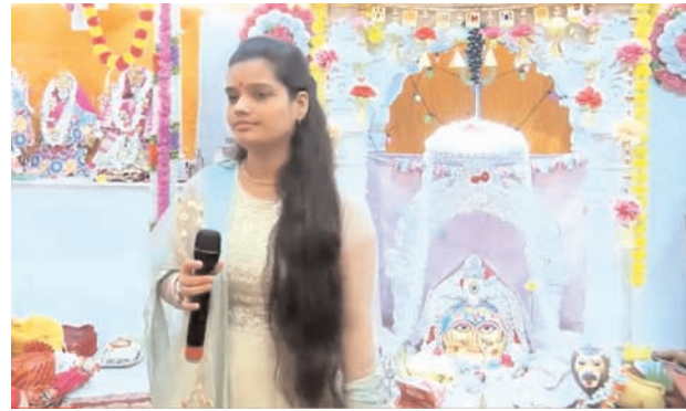
शयन आरती के साथ संपन्न होता है। दाहिमाती महिला मंडल द्वारा मंगल पाठ का किया गया है।

चेन्नई। यहां श्री माँ दधिमाती सेवा धाम दाहिमा भवन में श्री मद्रास दाहिमा ब्राह्मण महासभा के तत्वावधान में नवरात्रि महोत्सव दाहिमा भवन (सोकारपेट) के प्रांगण में बड़े ही धूमधाम से मनायी गई। विक्रम संवत् 2081 नूतन वर्ष के दिन घट स्थापना से महोत्सव का शुभ आरंभ हुआ। महोत्सव में प्रातः प्रतिदिन माँ दधिमाती का दूधाभिषेक, आरती, अर्चना, संध्या आरती, एवं