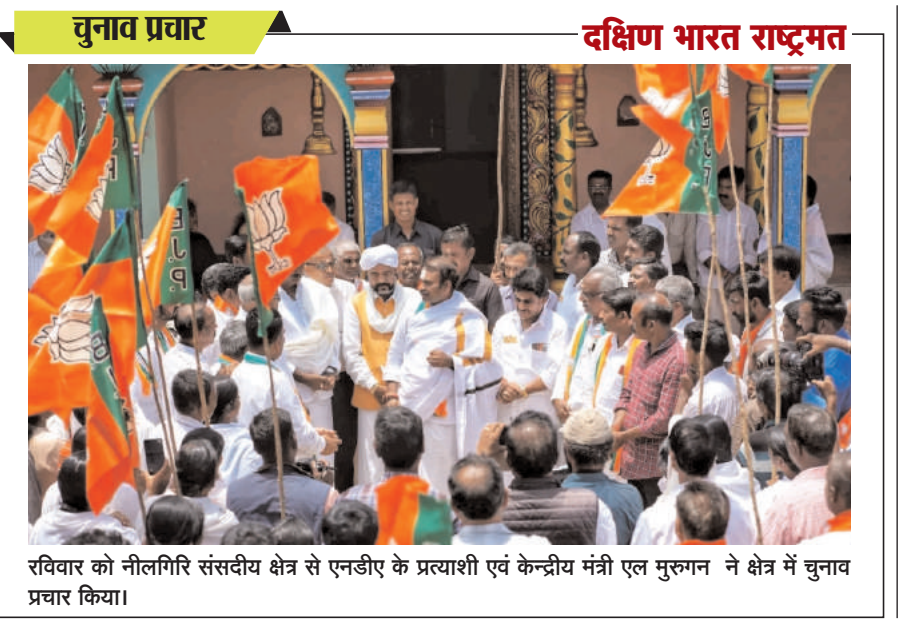
रविवार को नीलगिरि संसदीय क्षेत्र से पनडीए के प्रत्याशी एवं केन्द्रीय मंत्री एल मुरुगन ने क्षेत्र में चुनाव प्रचार किया।

उन्होंने बताया कि प्रधानमंत्री की सुरक्षा के लिए पहला घेरा नियमानुसार एसपीजी का होगा और दूसरा और तीसरा घेरा राज्य पुलिस के कर्मांडों और स्थानीय बल का होगा। अग्रवाल ने बताया कि प्रधानमंत्री मोदी का रोडशो शाम साढ़े छह बजे होगा, जिसके लिए सुरक्षा तैयारियां पूरी कर ली गयी हैं। उन्होंने बताया कि प्रधानमंत्री मोदी की सुरक्षा को देखते हुए रोड शो के दौरान पुलिस अधीक्षक स्तर के आठ और उपाधीक्षक स्तर के 25 अधिकारियों समेत कुल लगभग 1800 सुरक्षा कर्मियों की विशेष तैनाती की गई है। अधिकारी ने बताया कि रोडशो के दौरान शहर के यातायात को भी परिवर्तित किया जायेगा।