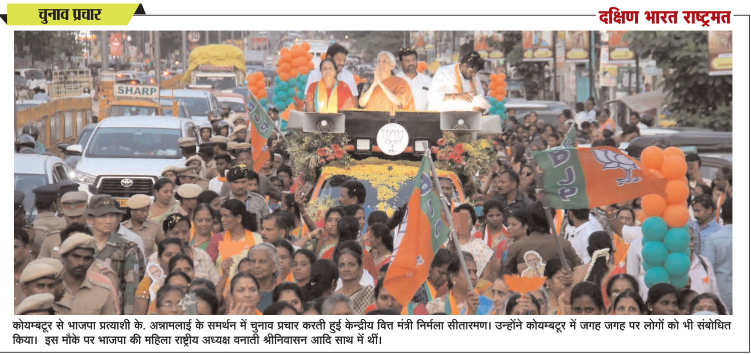
कोयम्बटूर से भाजपा प्रत्याशी के, अनामलाई के समर्थन में चुनाव प्रचार करती हुई केन्द्रीय वित्त मंत्री निर्मला सीतारमण। उन्होंने कोयम्बटूर में जगह जगह पर लोगों को भी संबोधित किया। इस मौके पर भाजपा की महिला राष्ट्रीय अध्यक्ष वनाती श्रीनिवासन आदि साथ में थीं।