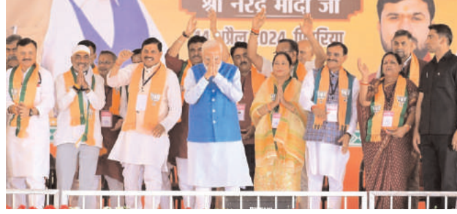
श्री नरेन्द्र मोदी जी, 15 अप्रैल 2024, पिपरिया

पिपरिया/भाषा। प्रधानमंत्री नरेन्द्र मोदी ने विपक्षी गठबंधन 'इंडि' के एक घटक दल के परमाणु निरस्त्रीकरण के पक्ष में बयान देने को लेकर रविवार को निशाना साधा और कहा कि बिना परमाणु हथियारों के देश की रक्षा नहीं की जा सकती। प्रधानमंत्री मोदी ने मध्य प्रदेश के होशंगाबाद लोकसभा क्षेत्र के पिपरिया कस्बे में एक जनसभा को संबोधित करते हुए कांग्रेस नेता राहुल गांधी के एक झटके में गरीबी उन्मूलन के दावे पर तंज कसते हुए कहा कि देश राहुल को गंभीरता से नहीं लेता। उन्होंने यह भी कहा कि कांग्रेस ने हमेशा डॉ. बाबासाहेब अम्बेडकर का अपमान किया लेकिन भाजपा सरकार ने उनका सम्मान किया है। प्रधानमंत्री मोदी ने किसी भी पार्टी का नाम लिए बिना मार्क्सवादी कम्युनिस्ट पार्टी (माकपा) के घोषणापत्र का जिक्र करते हुए कहा कि विपक्षी गठबंधन 'इंडि' के एक घटक दल ने परमाणु निरस्त्रीकरण का आह्वान किया है। मोदी ने लोगों से पूछा कि क्या आज के दौर में देश को परमाणु हथियार की जरूरत है या नहीं खासकर तब जब उसके दुश्मनों के पास इतनी ताकत है।