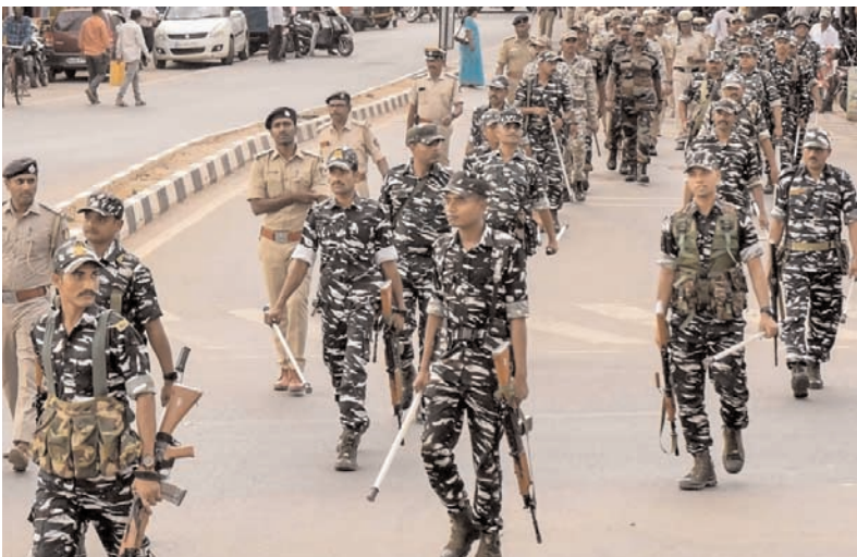
(तीन); पुदुकोट्टाई (तीन); रामनाथपुरम (चार); रामीपेट (तीन); सेलम (पांच); शिवगंगा (चार); तेनकासी (तीन); तंजावुर (छह); थेनी (छह); नीलगिरि (दो); थूथुकुडी (छह); तिरुचि (तीन); तिरुपतूर (चार); तिरुपुर (पांच); तिरुनेलवेली (तीन); तिरुवल्लूर (चार); तिरुवन्नालाई (पांच); तिरुवरुर (तीन); वेल्बोर (पांच); तिरुधनुर (पांच); और तिरुपुरम (पांच) ये अर्धसैनिक बल स्थानीय पुलिस के साथ मिलकर सुरक्षा की कमान संभालेंगे।

चेन्नई। चुनाव आयोग ने 19 अप्रैल को होने वाले पहले चरण के लोकसभा चुनाव के लिए तमिलनाडु में अर्धसैनिक बलों की 190 कंपनियां तैनात की हैं। जबकि, चेन्नई में अर्धसैनिक कर्मियों की सात कंपनियां तैनात की गई हैं, पड़ोसी क्षेत्र अवाडी और तांबरम में तीन-तीन कंपनियां दी गई हैं। जबकि मदुरै में सात कंपनियां तैनात की गई हैं। कोयंबटूर शहर को छह, तिरुपुर को तीन, तिरुचि और सेलम चार-चार; और तिरुनेलवेली तीन दी गई हैं। इन शहरों के अलावा, अर्धसैनिक बलों के जवानों की कंपनियों को निम्नलिखित जिलों में भी तैनात किया गया है - अरियालूर (दो); चेंगलपट्ट (तीन); कोयंबटूर (सात); कुड्डलोर (पांच); धर्मपुरी (चार); डिंडीगुल (चार); इरोड (चार); कन्नारुक्ुमिरी (तीन); कांचीपुरम (पांच); और ककर (तीन); कन्नियकुमारी (छह); कृष्णागिरि (चार); मदुरै (चार); मथिलाडुथुराई (दो); नागपट्टिनम (दो); नमक्कल (तीन); पेरम्बलूर