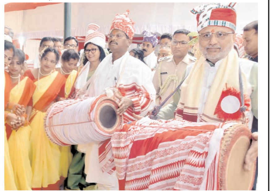
झारखंड के राज्यपाल सीपी राधाकृष्णन, केंद्रीय कृषि एवं जनजातीय मामलों के मंत्री अर्जुन मुंडा के साथ गुरुवार को रांची में 'सरहुल' पूजा उत्सव में आदिवासियों के साथ पारंपरिक ढोल 'मांदर' बजाते हुए।