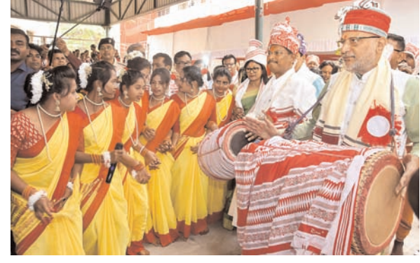
राधाकृष्णन और केंद्रीय मंत्री मुंडा ने रांची विश्वविद्यालय के जनजातीय और क्षेत्रीय भाषा विभाग द्वारा आयोजित सरहुल उत्सव में भाग लिया था। इस मौके पर राज्यपाल ने कहा, सरहुल वसंत ऋतु की शुरुआत के प्रतीक के रूप में पूरे

दक्षिण भारत राष्ट्रमत dakshinbharat.com रांची/भाषा। झारखंड का सबसे बड़ा आदिवासी त्योहार 'सरहुल' और मुस्लिम समुदाय का पर्व 'ईद-उल-फ़ितर' बृहस्पतिवार को पूरे राज्य में व्यापक सुरक्षा व्यवस्था के बीच धार्मिक और पारंपरिक उत्साह के साथ मनाया गया। झारखंड के राज्यपाल सी पी राधाकृष्णन, मुख्यमंत्री चंपई सोरेन और केंद्रीय मंत्री अर्जुन मुंडा ने सरहुल और ईद के मौके पर राज्य के नागरिकों को बधाई दी। सरहुल के अवसर पर बड़ी संख्या में पारंपरिक पोशाक पहने पुरुष, महिलाएं और बच्चे सड़कों पर उमड़ पड़े और उन्होंने राज्य के