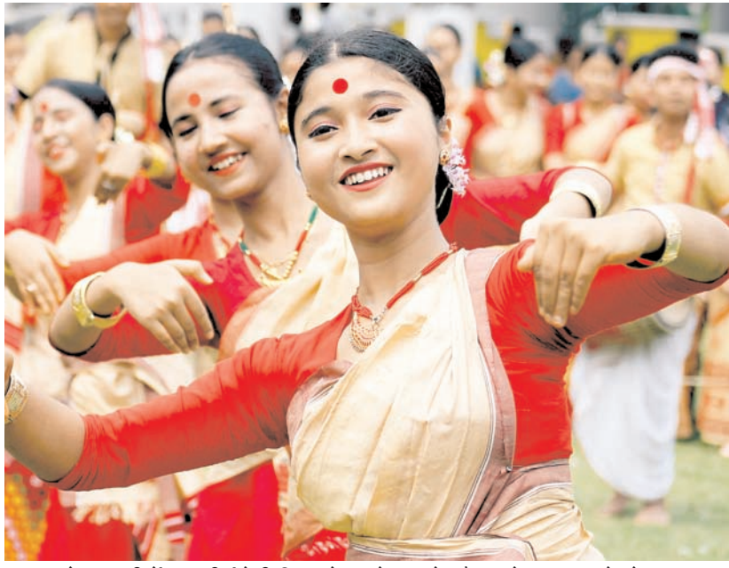
बुधवार को गुवाहाटी में आगामी रंगोली बिहू महोत्सव के जश्न के दौरान लोक नृत्य करते लोग।