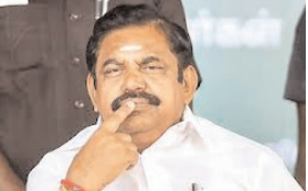
दक्षिण भारत राष्ट्रमत dakshinbharat.com

पलानीस्वामी के लिए अग्निपरीक्षा है लोकसभा चुनाव