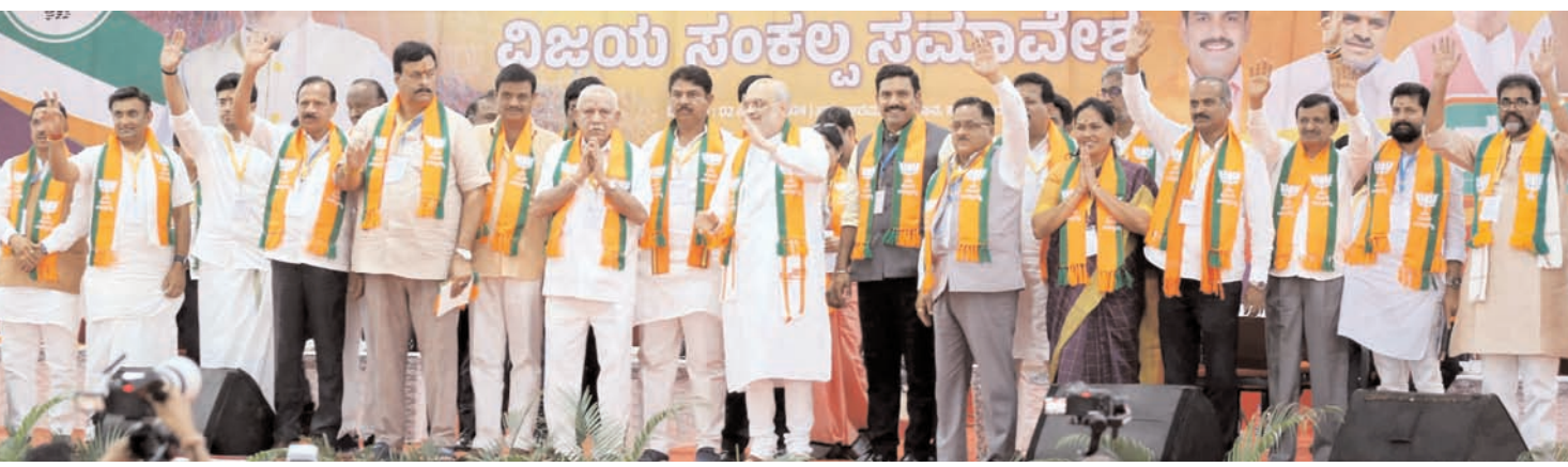
बेंगलूर में मंगलवार को पैलेस ग्राउन्ड में आयोजित 'पांच शक्ति केन्द्र' के कार्यक्रमों के समारोह में केन्द्रीय गृह मंत्री अमित शाह सभी का अभिवादन करते हुए।

अध्यक्ष और तमिलनाडु के मुख्यमंत्री एम करुणाधिनि को उस समय केंद्र में सत्तारूढ़