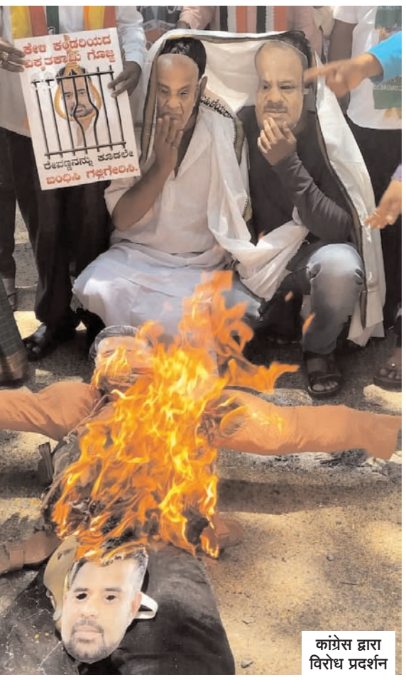
कांग्रेस द्वारा विरोध प्रदर्शन

आदेश में कहा गया है कि होलेनरासीपुर पुलिस थाने में भारतीय दंड संहिता की धारा 354 (ए) (यौन उत्पीड़न), 354 (डी) (पीछा करना) और 506 (आपराधिक धमकी) और 509 (महिला की गरिमा को ठेस पहुंचाने के मकसद से कुछ बोलना, इशारा या हरकत करना) के तहत प्राथमिकी दर्ज की गई है, जिसकी एसआईटी विस्तार से जांच करेगी। आदेश के अनुसार, राज्य के विभिन्न हिस्सों में दर्ज इस घटना से जुड़े सभी मामले एसआईटी को हस्तांतरित किए जाएं, जो जांच के दौरान सीआईडी के संसाधनों का उपयोग करेगी।