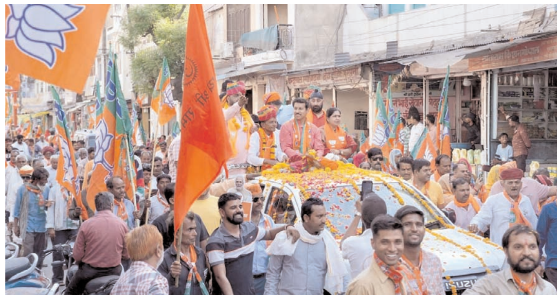
व्यावर में गुरुवार को राजसमंद लोकसभा क्षेत्र से भाजपा प्रत्याशी श्रीमती महिमा कुमारी मेवाड़ के समर्थन में आयोजित रोड शो में शामिल मंत्री राज्यवर्धन सिंह राठौड़।