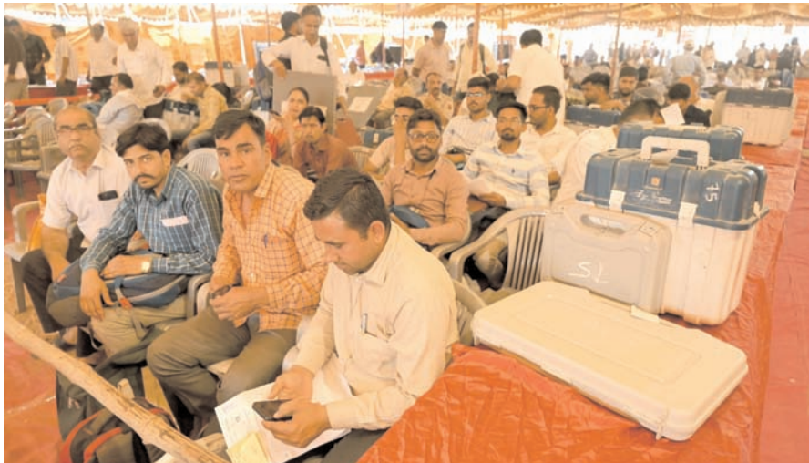
जोधपुर में गुरुवार को मतदान अधिकारी गुरुवार को राजस्थान के जोधपुर में वितरण केंद्र शेरागढ़ में दूसरे चरण के आम चुनाव-2024 के लिए आवश्यक इलेक्ट्रॉनिक वोटिंग मशीन (ईवीएम) और अन्य चुनाव संबंधी सामग्री ले जा रहे हैं।

जयपुर। राजस्थान में लोकसभा चुनाव के दूसरे चरण में 13 सीट पर शुक्रवार को मतदान होगा। अधिकारियों ने बताया कि सुबह सात बजे प्रारंभ होने वाले मतदान के लिए सभी तैयारियां पूरी कर ली गई हैं। अधिकारी ने बताया कि आम चुनाव के साथ ही बांसवाड़ा लोकसभा क्षेत्र के बागीदौरा विधानसभा सीट पर उपचुनाव भी होगा। राज्य में लोकसभा की कुल 25 सीटें हैं जिनमें से 12 पर मतदान 19 अप्रैल को हुआ। प्रदेश की जिन 13 सीट पर 26 अप्रैल को मतदान होगा, उनमें बाड़मेर, जोधपुर, जालौर, बांसवाड़ा, वित्तोडगढ़, कोटा, टोंक-सवाई माधोपुर, अजमेर, पाली, उदयपुर, राजसमंद, और झालावाड़-बारां सीट शामिल हैं।