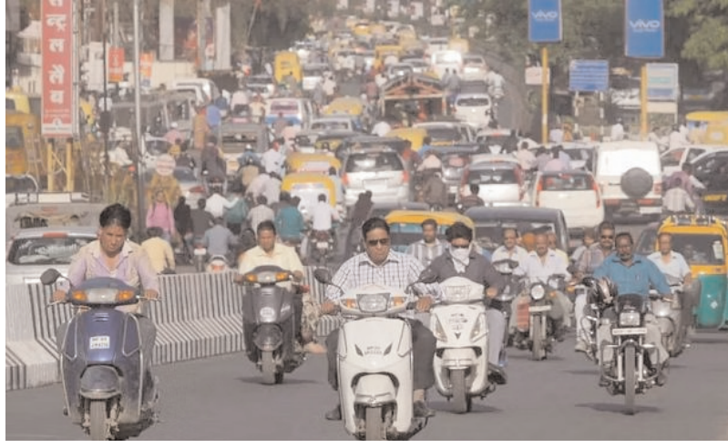
डिजाइन प्रणाली सुनिश्चित करना महत्वपूर्ण हो जाता है।

दिल्ली पुलिस की साल 2022 की एक रिपोर्ट के अनुसार, राजधानी में सड़क दुर्घटनाओं में पैदल चलने वालों के बाद दोपहिया वाहन चालक दूसरे सबसे अधिक पीड़ित हैं। रिपोर्ट में उल्लेख किया गया है कि 2022 में 539 दोपहिया वाहन चालकों की मृत्यु हुई, जो 2021 में 459 थी। ज्यादातर मामलों में, यह दोपहिया वाहन भारी वाहनों की चपेट में आए, उसके बाद चार पहिया वाहन आए। दिल्ली में पंजीकृत दोपहिया वाहनों की भारी संख्या को देखते हुए, इन सवारों की भलाई के लिए एक सुरक्षित