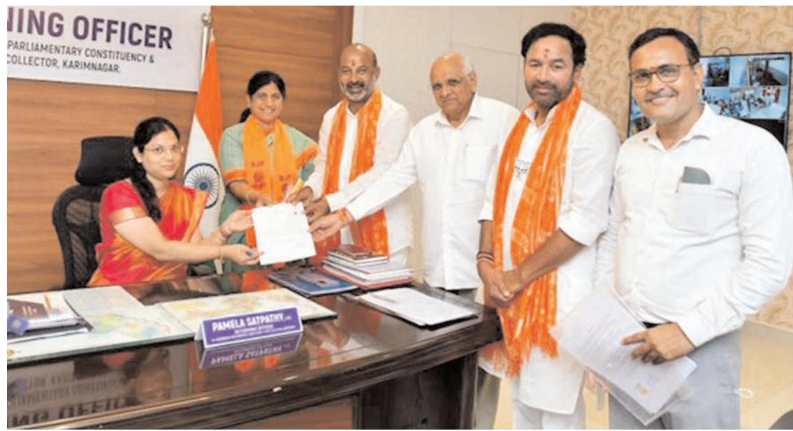
करिमाबाद में भाजपा के उम्मीदवार और राष्ट्रीय महासचिव बंदी संजय कुमार ने गुजरात के मुख्यमंत्री भूपेंद्र भाई पटेल, केंद्रीय पर्यटन मंत्री और तेलंगाना भाजपा अध्यक्ष जी किशन की उपस्थिति में लोकसभा चुनाव के लिए नामांकन पत्र दाखिल किया।