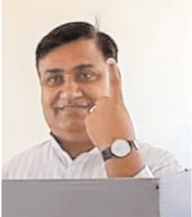
कांग्रेस नेता गोविंद सिंह डोटासरा