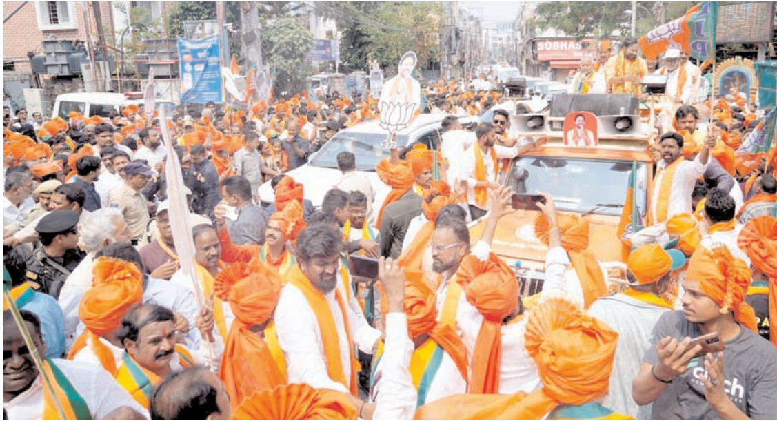
सिकंदराबाद से भाजपा उम्मीदवार जी. किशन रेड्डी पार्टी नेताओं के साथ शुक्रवार को सिकंदराबाद के मेहबूब कॉलेज में आगामी लोकसभा चुनाव के लिए नामांकन पत्र दाखिल करने जाते हुए।