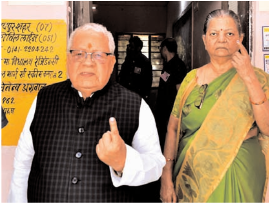
राज्यपाल कलराज मिश्र