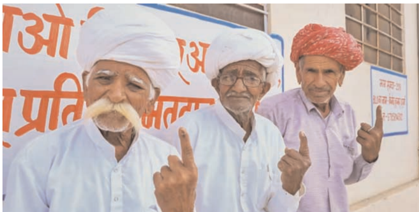
मतदान करने के बाद अंगुली का निशान दिखाते मतदाता।