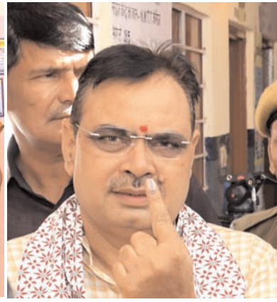
मुख्यमंत्री भजनलाल शर्मा