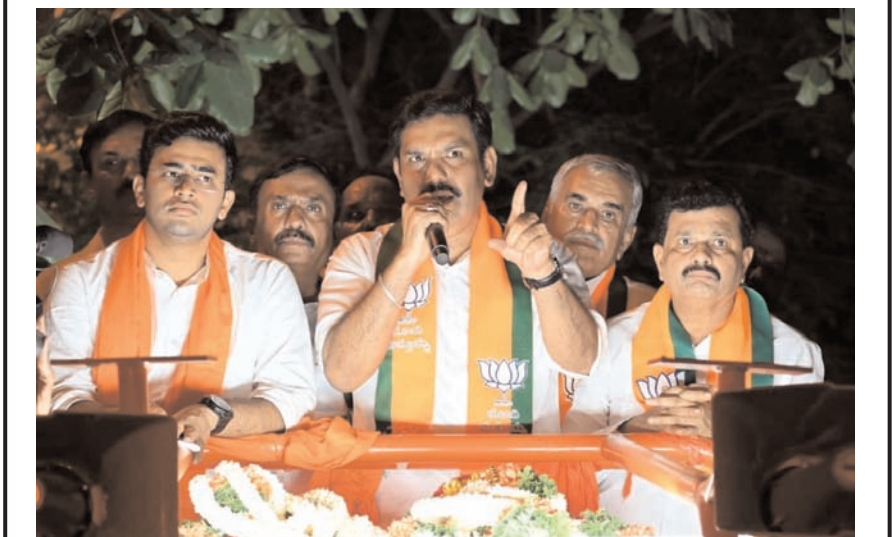
शुक्रवार देर शाम बंगलूरु दक्षिण से भाजपा के उम्मीदवार तेजस्वी सूर्या के पक्ष में प्रचार करते हुए भाजपा के प्रदेशाध्यक्ष विजयेन्द्र येडीयुरप्पा।