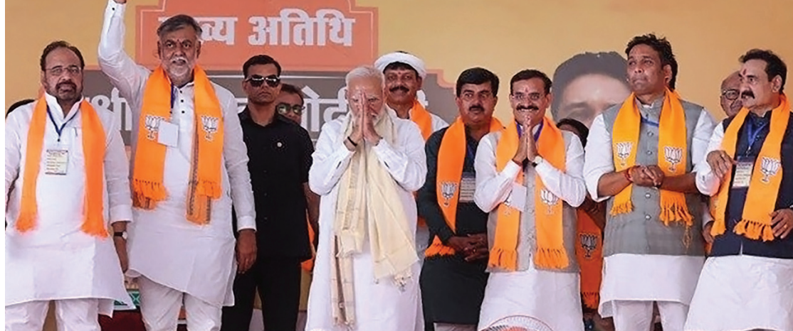
दुनिया पर युद्ध के बादल मंडरा रहे हैं; ऐसे में

भारत ने फिलीपीन को ब्रह्मोस मिसाइलों की पहली खेप की आपूर्ति की नई दिल्ली/भाषा। भारत ने शुक्रवार को फिलीपीन को ब्रह्मोस सुपरसोनिक क्रूज मिसाइलों की पहली खेप की आपूर्ति की। दक्षिण चीन सागर में चीन द्वारा दिखाई जा रही सैन्य आक्रामकता के मद्देनजर यह आपूर्ति दोनों देशों के बीच बढ़ते सैन्य संबंधों को दर्शाते हैं। दक्षिण पूर्व एशियाई देश फिलीपीन के साथ इस हथियार प्रणाली की आपूर्ति के लिए 37.5 करोड़ अमेरिकी डॉलर का करार होने के दो साल के बाद आपूर्ति की गई है।