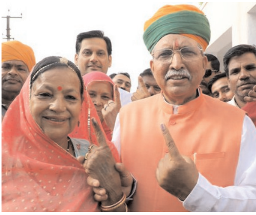
केंद्रीय मंत्री अर्जुनराम मेघवाल