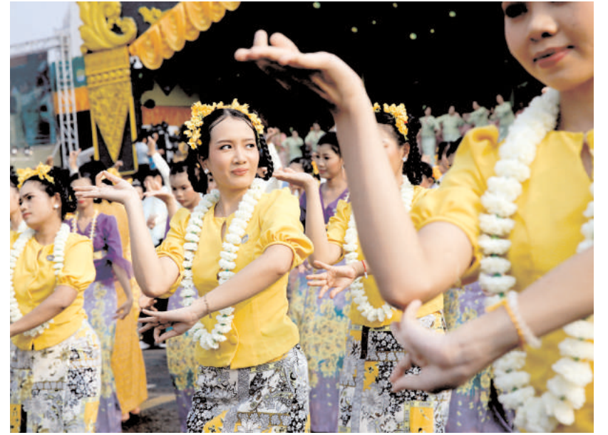
म्यांमार के यांगून में थिंगयान जल उत्सव के जश्न के दौरान प्रदर्शन करते लोग। म्यांमार का जीवंत थिंगयान जल उत्सव शनिवार को शुरू हो गया, जिसके साथ पूरे देश में जश्न मनाया जा रहा है।