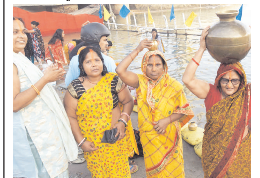
पटना में शनिवार को चैती छठ पूजा उत्सव के दौरान गंगा नदी के तट पर पूजा करने के बाद बर्तन ले जाते श्रद्धालु।