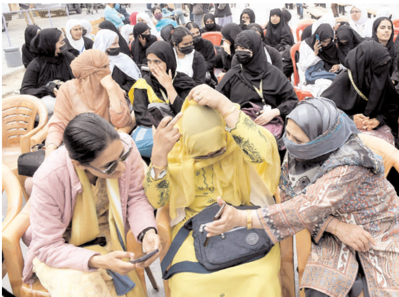
श्रीनगर में संसदीय चुनाव के लिए मतदाताओं को जागरूक करने के लिए शनिवार को श्रीनगर के लाल चौक स्थित ऐतिहासिक गंदा घर में एक नुक़ड़ नाटक खेला गया।