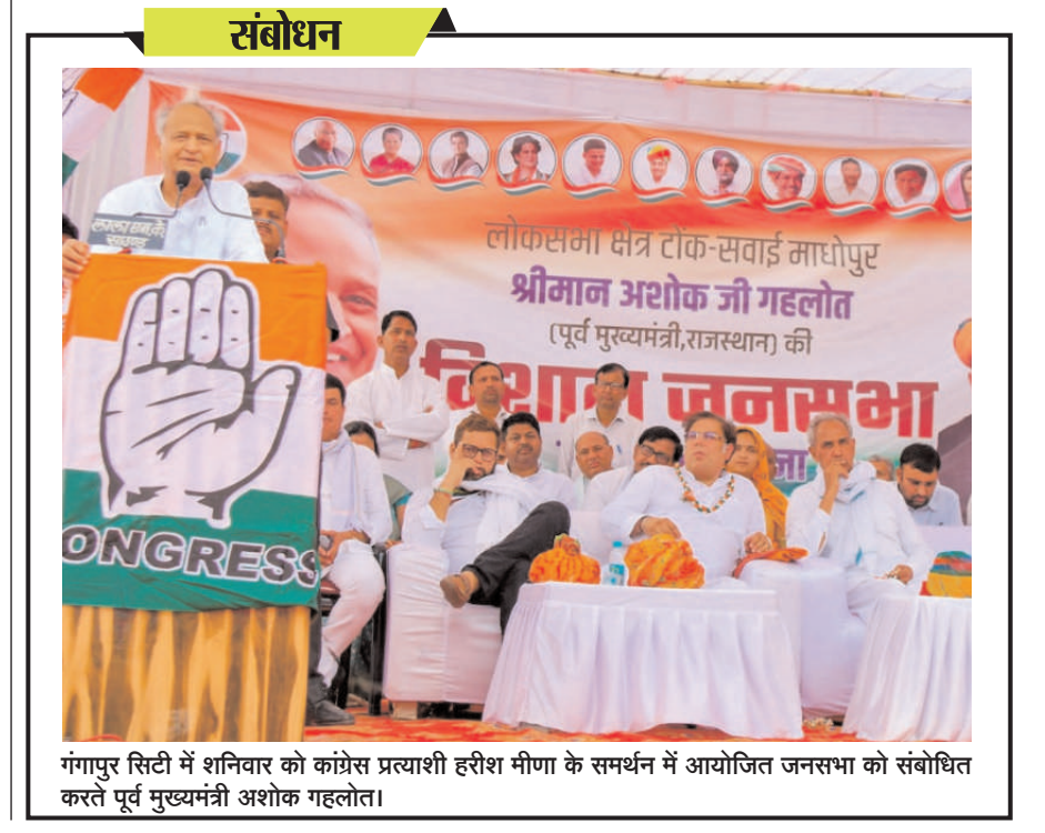
गंगापुर सिटी में शनिवार को कांग्रेस प्रत्याशी हरीश मीणा के समर्थन में आयोजित जनसभा को संबोधित करते पूर्व मुख्यमंत्री अशोक गहलोत।

किए जाएंगे। चिकित्सा एवं स्वास्थ्य विभाग की अतिरिक्त मुख्य सचिव शुभा सिंह ने शनिवार को लू एवं गर्मी जनित बीमारियों से बचाव, उपचार एवं जागरूकता गतिविधियों को लेकर राज्य स्तरीय मीडियो कॉन्फ्रेंस में इस संबंध में निर्देश दिए। आधिकारिक बयान के अनुसार इसमें शुभासिंह ने कहा कि गर्मी बढ़ने पर अगले दो से तीन माह चुनौतीपूर्ण हो सकते हैं, ऐसे में विभाग हर स्थिति से निपटने के लिए तैयार रहे। उन्होंने कहा कि गर्मी एवं लू का स्तर बढ़ने पर चेतावनी यलो, ऑरेंज एवं रेड अलर्ट के अनुसार श्रेणीबद्ध प्रणाली तैयार कर आवश्यक कदम उठाए जाएंगे। उन्होंने कहा कि आमजन को लू एवं गर्मी जनित बीमारियों की स्थिति में तत्काल उपचार एवं अन्य स्वास्थ्य सेवाएं उपलब्ध करवाने के लिए 'ट्रीटमेंट प्रोटोकॉल' तैयार किया जाए। एम्बुलेंस की क्रियाशीलता की जांच करने के साथ ही प्राथमिक उपचार के लिए किट तैयार करवाई जाएं। अस्पतालों में विशेष वार्ड बनाए जाएं। दवाओं एवं जांच किट्स की पर्याप्त उपलब्धता रहे। चिकित्सकों, पैरामेडिकल स्टाफ सहित निचले स्तर तक आवश्यक प्रशिक्षण दिया जाए। अधिकारी ने कहा कि लू एवं तेज गर्मी की स्थिति में आमजन को बीमारियों से बचाने के लिए श्रम विभाग, कृषि विभाग, ग्रामीण विकास एवं पंचायती राज, स्थानीय निकाय विभाग, शिक्षा विभाग सहित विभिन्न विभागों के साथ समन्वय रखते हुए कार्य योजना बनाई जाए।