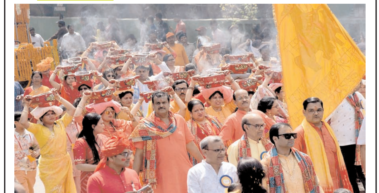
पटना के श्याम मंदिर द्वारा रविवार को आयोजित खादू श्याम जी की फागुन शोभा यात्रा में शामिल श्रद्धालु।