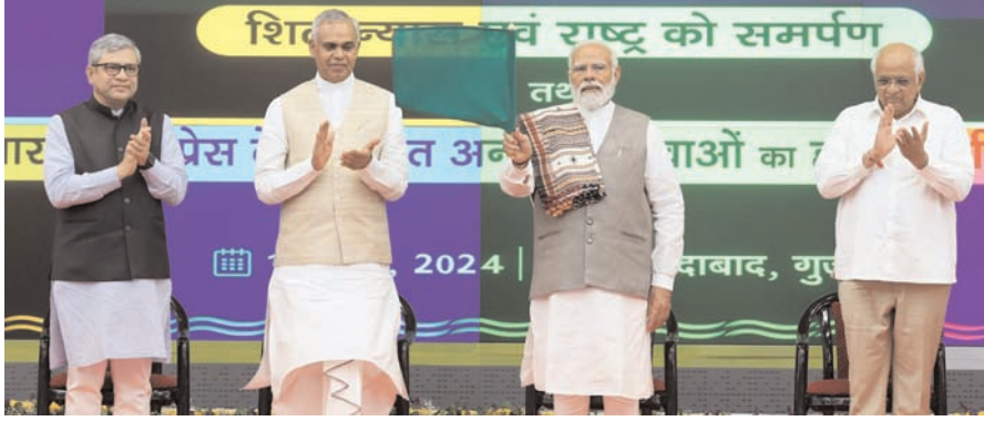
भारत एक्सप्रेस गाड़ियों का शुभारंभ किया और चार मौजूदा वंदे भारत एक्सप्रेस ट्रेन के मार्ग का विस्तार का भी उद्घाटन किया। कार्यक्रम में गुजरात के राज्यपाल आचार्य देवव्रत, मुख्यमंत्री भूपेन्द्र पटेल,

मोदी ने आज यहां एवं वर्चुअल माध्यम से आयोजित अब तक के सबसे बड़े सरकारी आयोजन में एक लाख छह हजार करोड़ रुपये की परियोजनाओं का लोकार्पण किया जिनमें से 85 हजार 457 करोड़ रुपये की परियोजनाएं सिर्फ रेलवे से जुड़ी हैं। प्रधानमंत्री ने दस नयी वंदे