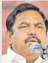
वेन्नई। आल इंडिया अन्ना द्रविड़ मुनेत्र कषमम (अनाद्रमुक) महासचिव ए के पलानीस्वामी ने नागरिकता (संशोधन) अधिनियम (सीएए) के लागू होने की आलोचना की और कहा कि केंद्र सरकार ने इसके कार्यान्वयन के साथ एक ऐतिहासिक भूल की है। उन्होंने भाजपा पर राजनीतिक लाभ के लिए ऐसा करने का आरोप लगाया है। उन्होंने कहा, 'अनाद्रमुक इस कदम की कड़ी निंदा करती है, जिसका उद्देश्य राजनीतिक लाभ लेने के लिए लोकसभा चुनाव से पहले लोगों को विभाजित करना है। जबकि इसे पिछले पांच वर्षों से लागू नहीं किया गया था।' राज्य विधानसभा में नेता प्रतिपक्ष पलानीस्वामी ने सोमवार देर रात सोशल मीडिया चैनल 'एक्स' पर एक पोस्ट में कहा, केंद्र सरकार ने इसे लेकर एक ऐतिहासिक भूल की है। अनाद्रमुक इसे स्वदेशी लोगों - मुसलमानों और श्रीलंकाई तमिलों के खिलाफ लागू करने के किसी भी प्रयास की अनुमति नहीं देगी। अनाद्रमुक देश के लोगों के साथ मिलकर लोकतांत्रिक तरीके से इसका विरोध करेगी। नागरिकता (संशोधन) अधिनियम, 2019 पाकिस्तान, बांग्लादेश और अफगानिस्तान से 31 दिसंबर, 2019 से पहले भारत आए गैर-मुस्लिम प्रवासियों - हिंदू, सिख, जैन, बौद्ध, पारसी और ईसाई समुदायों के लोगों को भारत की नागरिकता प्रदान करने की अनुमति देता है। केंद्र द्वारा सोमवार को सीएए के नियमों को अधिसूचित किया गया।