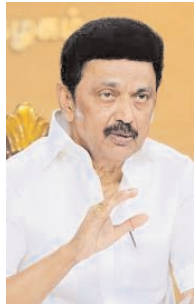
दक्षिण भारत राष्ट्रमत dakshinbharat.com

चेन्नई। तमिलनाडु के मुख्यमंत्री एम के स्टालिन ने नागरिकता (संशोधन) अधिनियम (सीएए) को 'विभाजनकारी और बेकार' बताते हुए मंगलवार को इसे खारिज कर दिया और कहा कि इसे उनके राज्य में लागू नहीं किया जाएगा। मुख्यमंत्री एम के स्टालिन ने लोकसभा चुनाव नजदीक होने के बीच सीएए लागू करने के लिए नियमों को 'जल्दबाजी में' अधिसूचित करने को लेकर केंद्र सरकार पर निशाना साधा और कहा कि सीएए और इसके नियम संविधान की मूल संरचना के खिलाफ हैं। उन्होंने कहा, 'सीएए से कोई लाभ नहीं होने वाला है। यह भारतीय जनता के बीच सिर्फ फूट डालने का रास्ता तैयार करेगा। उनकी सरकार का रुख यह है कि यह कानून पूरी तरह अनुचित है और इसे निरस्त किया जाना चाहिए।' एक आधिकारिक विज्ञापित के अनुसार, स्टालिन ने कहा, 'इसलिए, तमिलनाडु सरकार राज्य में सीएए लागू करने का किसी भी तरीके से कोई अवसर नहीं देगी।' राज्य में सत्कारुद्र द्रविड़ मुनेत्र कषमम (द्रमुक) के अध्यक्ष स्टालिन ने दोहराया कि सीएए बहुलवाद, धर्मनिरपेक्षता, अल्पसंख्यक समुदायों और श्रीलंकाई तमिल शरणार्थियों के खिलाफ है।