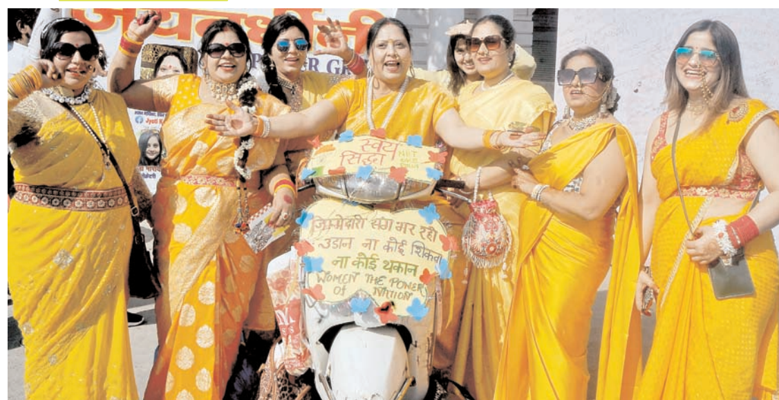
नई दिल्ली में रविवार को जेके टावर द्वारा आयोजित ऑल-युमन बाइक रैली में भाग लेती महिलाएं।