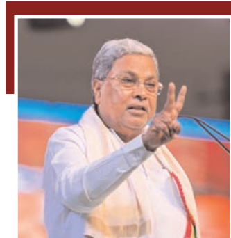
दक्षिण भारत राष्ट्रमत dakshinbharat.com

बेंगलूर। मुख्यमंत्री सिद्धरामैया ने पूछा कि क्या देवेगोड़ा भूल गए हैं कि उन्होंने कहा था कि अगर नरेंद्र मोदी प्रधानमंत्री बने तो वह देश छोड़ देंगे। वह कर्नाटक विधान परिषद के शिक्षक निर्वाचन क्षेत्र के उपचुनाव में पुट्टना की जीत के मद्देनजर रविवार को केंगरी में आयोजित शिक्षक धन्यवाद सभा में बोल रहे थे। मुख्यमंत्री ने कहा कि उन्हें बहुत हैरानी है कि पूर्व प्रधानमंत्री देवेगोड़ा ने अब बीजेपी से हाथ मिला लिया है और मोदी की तारीफ कर रहे हैं। उन्होंने याद दिलाते हुए कि देवेगोड़ा ने एक बार कहा था कि वह अगले जन्म में मुस्लिम के रूप में पैदा होना चाहते हैं और हमेशा बीजेपी के खिलाफ रहे हैं। अब उन्होंने अपनी पार्टी के अस्तित्व के लिए खुद को बीजेपी के साथ जोड़ लिया है। आज देश की जनता आपकी तरह समझदार है। देश की जनता उनके बयानों की जांच और तुलना कर सकती है। मुख्यमंत्री ने कहा कि देवेगोड़ा अपने परिवार के अस्तित्व के