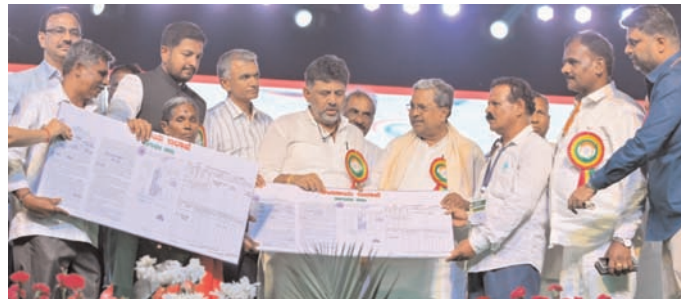
रविवार को होसकोटे में आयोजित एक समारोह में मुख्यमंत्री सिद्धरामैया, एवं उपमुख्यमंत्री डीके शिवकुमार सरकार की योजनाओं का आदि लाभार्थियों को लाभ पहुंचाते हुए।

लिए राजनीतिक तौर पर चाहे जो भी फैसला लें, उन्हें लगता है कि लोग आंखें मूंद लें और उनका समर्थन करें। उन्होंने कहा, लेकिन अब ऐसी कोई स्थिति नहीं है। इससे पहले, जब मैं जनता दल एस में था, तो पुट्टना को भरोसा था कि शिक्षक उनका समर्थन करेंगे और उन्होंने कहा था कि यह चुनाव लड़ेंगे। उन्होंने 2002 में लोगों के आशीर्वाद से जीत हासिल की। तब से वह पांच बार जीत चुके हैं। उन्होंने लोगों की आवाज बनकर कुशलता से काम किया है और मुख्यमंत्री ने शिक्षक समुदाय की बुद्धिमत्ता के लिए सारहना व्यक्त की, जिन्होंने भाजपा से कांग्रेस में आने के बावजूद पुट्टना का समर्थन किया। विचार है कि डी.के.सुरेश जीतेंगे : कुमारास्वामी ने कहा था कि 'बीजेपी और जेडीएस का गठबंधन लोकसभा चुनाव को नई दिशा देगा। अब जनता को फैसला करना है। बेंगलूर ग्रामीण से डीके सुरेश