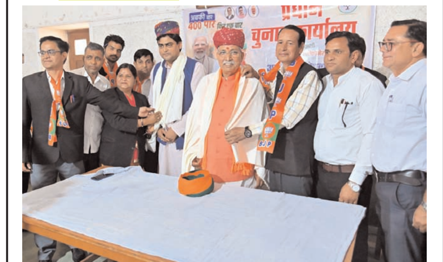
बीकानेर में शनिवार को लोकसभा क्षेत्र से भाजपा प्रत्याशी अर्जुनराम मेघवाल ने मोहता भवन चुनाव कार्यालय पर अधिवक्ता बंधुओं के साथ आयोजित बैठक में सभी साधियों से भाजपा को विजयी बनाने का संकल्प लिया।