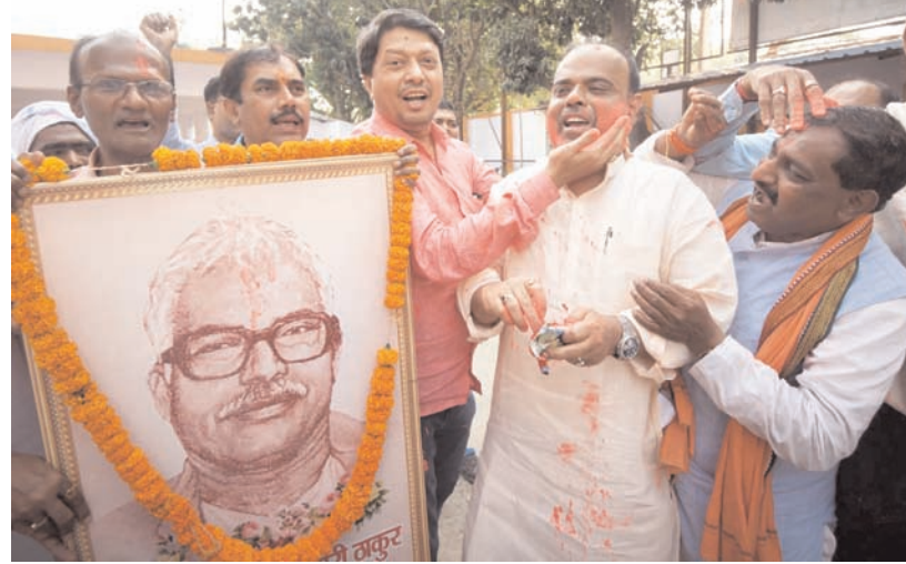
पटना में राष्ट्रपति द्वारा बिहार के पूर्व मुख्यमंत्री स्वर्गीय कर्पूरी ठाकुर को भारत रत्न विये जाने के बाद भाजपा के पिछड़े वर्ग के कार्यकर्ता शनिवार को पटना स्थित पार्टी कार्यालय में जश्न मनाते हुए।