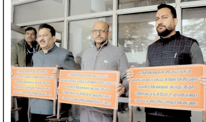
शिमला में शनिवार को विधानसभा अध्यक्ष द्वारा उनके इस्तीफे स्वीकार नहीं किए जाने के विरोध में खड़े तीन निर्दलीय विधायक।