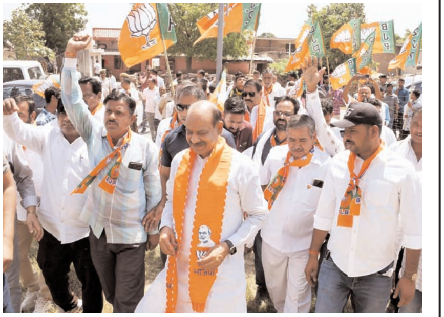
बूंदी के केशवरायपाटन में शनिवार को ओम बिरला बलदेवपुरा, कोटडी, घाट का बराना, झपायता, दहीखेड़ी, नोताड़ा, लक्ष्मीपुरा, रेबारपुरा क्षेत्र में जनसम्पर्क कर लोक सभा चुनाव में भारतीय जनता पार्टी को अपना स्नेहाशील प्रदान करने का आग्रह किया।