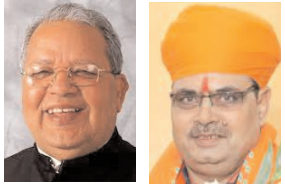
जहां के कण-कण में त्याग, तपस्या और बलिदान की गाथाएं समाहित हैं।

राज्यपाल मिश्र ने सोशल मीडिया मंच 'एक्स' पर पोस्ट कर कहा, राजस्थान दिवस की हार्दिक बधाई एवं शुभकामनाएं। 'राजस्थान' नाम ही मन में गौरव की अन्तर्भूति कराने वाला है। भक्ति और शक्ति का संगम यह वह प्रदेश है