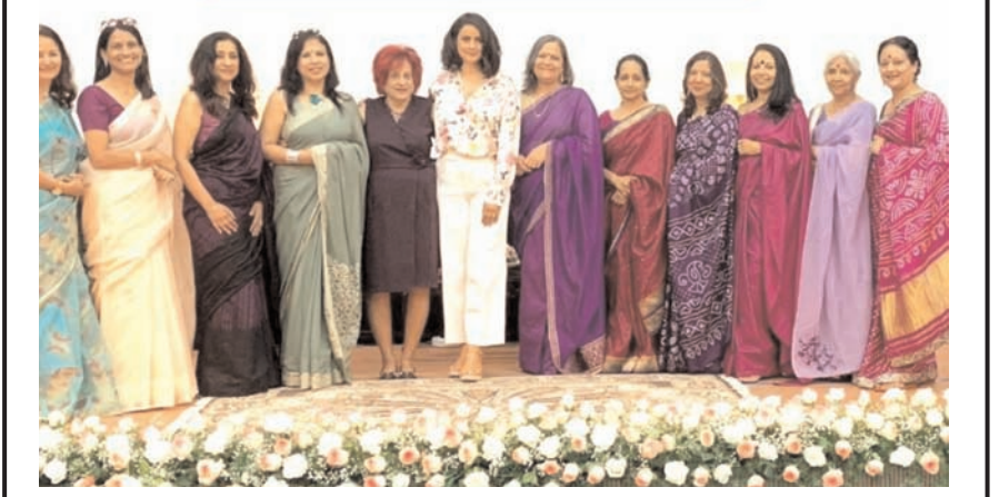
एक महीने तक चलने वाले महिला दिवस समारोह-2024 के समापन के लिए वायुसेना परिवार कल्याण संघ (क्षेत्रीय) बंगलूरु ने एएफएफडब्ल्यू बैठक का आयोजन किया। कार्यक्रम की मुख्य अतिथि अभिनेत्री गुल पनाग थीं। इस आयोजन का उद्देश्य 'समावेशी को प्रेरित करना' था। महीने के दौरान संगीतियों के शारीरिक एवं मानसिक विकास के लिए विभिन्न गतिविधियां आयोजित की गईं।