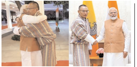
मूटान का विश्वनीय भागीदार है भारत : मूटानी प्रधानमंत्री टोबगो

नई दिल्ली/बाधा। बजाज फाइनेंस, पीरामल एंटरप्राइजेज और एडलवाइस ग्रुप जैसी वित्तीय सेवा कंपनियों ने मिलकर एक अप्रैल, 2019 और जनवरी 2024 के बीच 87 करोड़ रुपए के चुनावी बॉण्ड खरीदे। पीरामल एंटरप्राइजेज, पीएचएल फिनवेस्ट प्राइवेट लिमिटेड और पीरामल कैपिटल एंड हाउसिंग फाइनेंस ने इस अवधि के दौरान 60 करोड़ रुपए के बॉण्ड खरीदे। चुनाव आयोग द्वारा बृहस्पतिवार शाम को प्रकाशित विवरण के अनुसार, इसके बाद एडलवाइस समूह की तीन संस्थाओं ने चार करोड़ रुपए के बॉण्ड खरीदे, जबकि बजाज फाइनेंस ने 20 करोड़ रुपए के बॉण्ड खरीदे। स्वर्ण पर कर्ज देने वाली वित्तीय कंपनी म्यूटु फाइनेंस ने इस अवधि के दौरान तीन करोड़ रुपए के चुनावी बॉण्ड खरीदे। हालांकि, प्रामात्त राजनीतिक दलों के नामों का खुलासा नहीं किया गया। संघर्ष करने पर इन कंपनियों ने फिलहाल कोई प्रतिक्रिया नहीं दी है।