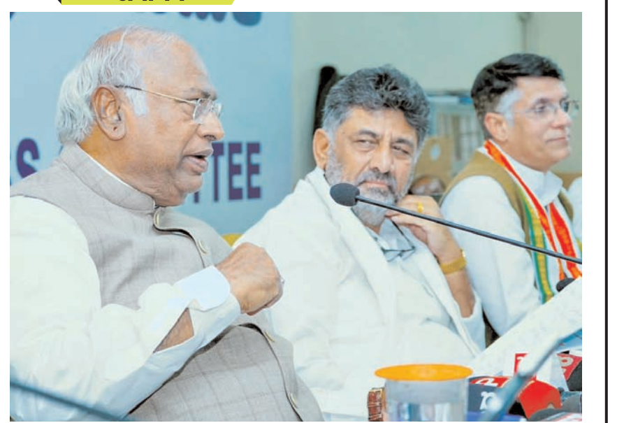
बंगलूरु में शुक्रवार को कांग्रेस अध्यक्ष मन्दिर्कार्जुन खरगे और केपीसीसी अध्यक्ष डीके शिवकुमार केपीसीसी कार्यालय में एक संवाददाता सम्मेलन को संबोधित करते हुए।