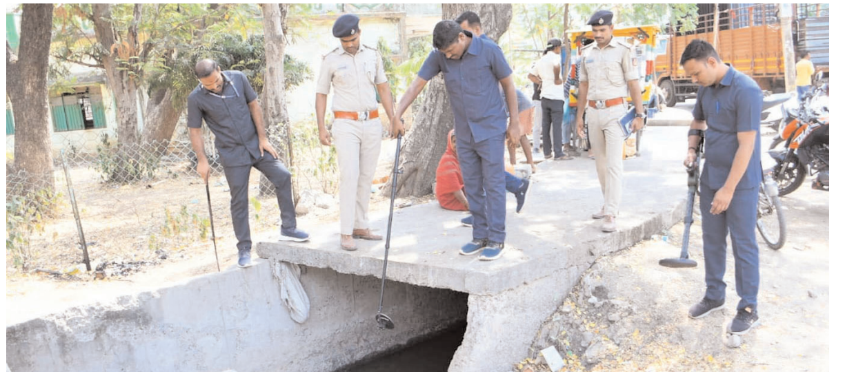
कलबुर्गी में शुक्रवार को पीएम नरेंद्र मोदी के कार्यक्रम के लिए सुरक्षा व्यवस्था देखते सुरक्षाकर्मी।

मामला बृहस्पतिवार को उस समय सामने आया जब एक व्यक्ति ने होटल के 'रिसेप्शन डेस्क' पर शिकायत की कि महिला फोन कॉल नहीं उठा रही है। जब होटलकर्मियों ने महिला के कमरे में जाकर देखा तो उन्हें वह मृत मिली जिसके बाद पुलिस में शिकायत दर्ज कराई गई। पुलिस ने बताया कि शव को पोस्टमॉर्टलम के लिए बॉरिंग अस्पताल ले जाया गया है और मामले की जांच जारी है।