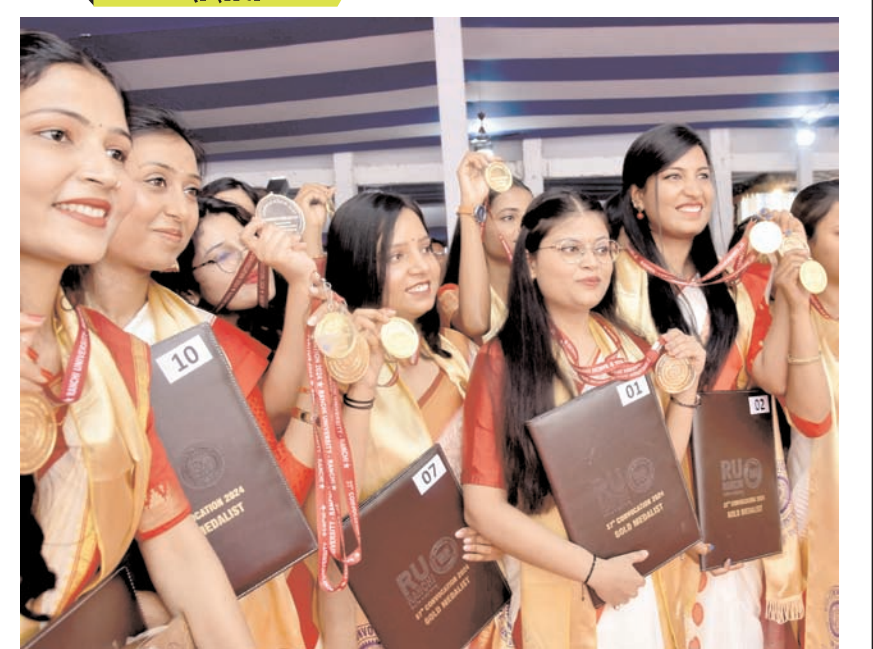
रांची विश्वविद्यालय के 37वें दीक्षांत समारोह में शुक्रवार को मेधावी टॉपर छात्र स्वर्ण पदक दिखाते हुए।