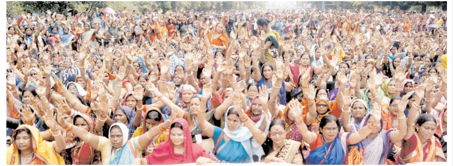
ओडिशा पंचायत स्तरीय महासंघ जीपीएलएफ ईसी के सदस्य शुक्रवार को भुवनेश्वर में अपनी विभिन्न मांगों के समर्थन में प्रदर्शन करते हुए।