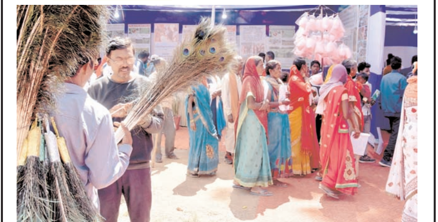
रांची के बिरसा कृषि विश्वविद्यालय (बीएचयू) में शनिवार को कृषि मेले के दौरान कृषि उत्पादों को देखते आगंतुक।