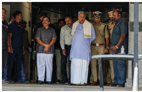
कर्नाटक के मुख्यमंत्री सिद्धरामैया ने शनिवार को बेंगलूरु में रामेश्वरम कैफे विस्फोट स्थल का दौरा किया।

सूची में उत्तर प्रदेश की 51 सीट, पश्चिम बंगाल की 20, मध्य प्रदेश की 24, गुजरात और राजस्थान की 15-15 सीट, केरल और तेलंगाना की 12-12 सीट, झारखंड, छत्तीसगढ़ और असम की 11 सीट तथा दिल्ली की पांच सीट सहित कुछ अन्य प्रदेशों व केंद्र शासित प्रदेशों के उम्मीदवार की घोषणा की गई है। दिल्ली की सूची सबसे अधिक चौंकाने वाली रही। पार्टी