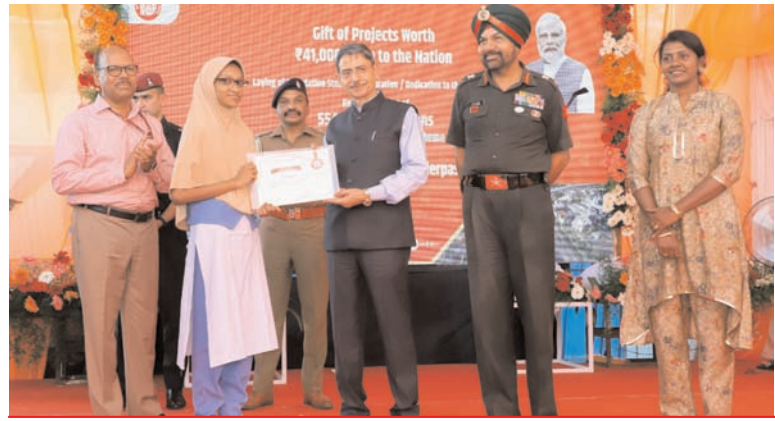
तमिलनाडु के राज्यपाल आरएन रवि ने सेंट थॉमस मार्गट रेलवे स्टेशन पर भाग लिया।