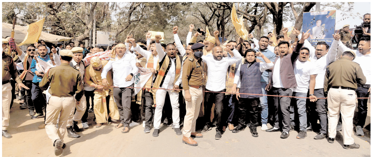
गुवाहाटी में ऑल ताई अहोम स्टूडेंट्स यूनियन (एटीएसयू) के कार्यकर्ताओं ने सोमवार को गुवाहाटी में ताई अहोम समुदाय के लिए एसटी दर्जे की मांग को लेकर विरोध प्रदर्शन किया।