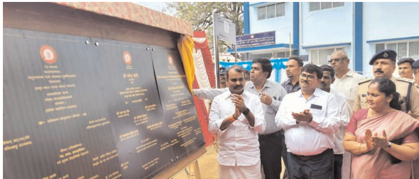
केंद्रीय मंत्री एल. मुत्तगन ने मेडुपुल्लायम रेलवे स्टेशन पर भाग लिया।