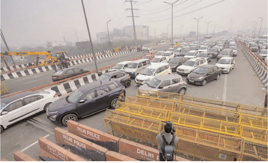
सीमा बिंदुओं पर कई चरणों में बैरिकेड लगाने के अलावा कंक्रीट ब्लॉक, लोहे की कीलें और कंटेनर की दीवारें बना सुरक्षा बढ़ा दी है।

नई दिल्ली/भाषा। प्रदर्शनकारी किसानों को दिल्ली में प्रवेश करने से रोकने के लिए सिंधु, टीकरी और गाजीपुर बॉर्डर पर किए गए उपायों के कारण मंगलवार सुबह दिल्ली-राष्ट्रीय राजधानी क्षेत्र में वाहन चालकों को भारी जाम का सामना करना पड़ा। बॉर्डर पर यातायात धीमी गति से चला क्योंकि पुलिस ने राष्ट्रीय राजधानी में किसानों के मार्च के मद्देनजर सिंधु, टीकरी और गाजीपुर सीमाओं पर कई स्तर पर बैरिकेड लगाए थे। यात्रियों को यातायात जाम से जूझना पड़ा और किसानों के प्रवेश को रोकने के लिए दिल्ली को किले में तब्दील कर दिया गया। किसानों के 'दिल्ली चलो' मार्च के मद्देनजर पुलिस ने शहर के