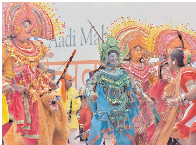
नई दिल्ली में शनिवार को मेजर ध्यानचंद नेशनल स्टेडियम में आदि महोत्सव 2024 के उद्घाटन के अवसर पर प्रस्तुति देते लोक नर्तक।