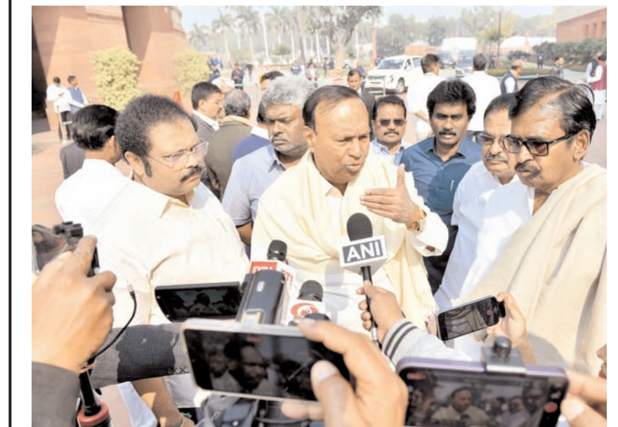
नई दिल्ली में द्रमुक नेता टी आर बालू शनिवार को नई दिल्ली में संसद भवन में पार्टी सांसदों के साथ पत्रकारों से बात करते हुए।