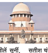
पीठ ने अटॉर्नी जनरल आर वेंकटरमणी, सोलिसिटर जनरल तुषार मेहता, वरिष्ठ अधिवक्ता कपिल सिब्बल और राज्यों की तरफ से पेश वरिष्ठ अधिवक्ताओं की दलीलें सुनीं, जिसमें डीबी किविया फैसले की समीक्षा का अनुरोध किया गया। शीर्ष अदालत ने 2004 में फैसला सुनाया था कि सदियों से बहिष्कार, भेदभाव और अपमान झेलने वाले एससी समुदाय सजातीय वर्ग का प्रतिनिधित्व करते हैं, जिनका उप-वर्गीकरण नहीं किया जा सकता।

दक्षिण भारत राष्ट्रमत dakshinbharat.com नई दिल्ली/भाषा। उच्चतम न्यायालय ने बृहस्पतिवार को उस कानूनी सवाल पर अपना आदेश सुरक्षित रख लिया कि क्या किसी राज्य सरकार को दाखिले और सरकारी नौकरियों में आरक्षण देने के लिए अनुसूचित जाति (एससी) और अनुसूचित जनजाति (एसटी) में उप-वर्गीकरण करने का अधिकार है। प्रधान न्यायाधीश डी वाई चंद्रचूड़ के नेतृत्व वाली सात-न्यायाधीशों की संविधान पीठ ने अटॉर्नी जनरल आर वेंकटरमणी, सोलिसिटर जनरल तुषार मेहता, वरिष्ठ अधिवक्ता कपिल सिब्बल और राज्यों की तरफ से पेश वरिष्ठ अधिवक्ताओं की दलीलें सुनीं, जिसमें डीबी किविया फैसले की समीक्षा का अनुरोध किया गया। शीर्ष अदालत ने 2004 में फैसला सुनाया था कि सदियों से बहिष्कार, भेदभाव और अपमान झेलने वाले एससी समुदाय सजातीय वर्ग का प्रतिनिधित्व करते हैं, जिनका उप-वर्गीकरण नहीं किया जा सकता। पीठ ने न्यायमूर्ति बी आर गवई, न्यायमूर्ति विक्रम नाथ, न्यायमूर्ति बेला एम त्रिवेदी, न्यायमूर्ति पंकज मिथल, न्यायमूर्ति मनोज मिश्रा और न्यायमूर्ति सतीश चंद्र मिश्रा शामिल हैं। पीठ 23 याचिकाओं पर सुनवाई कर रही है जिनमें पंजाब सरकार द्वारा दायर एक प्रमुख याचिका भी शामिल है। इस याचिका में पंजाब और हरियाणा उच्च न्यायालय के 2010 के फैसले को चुनौती दी गई है। शीर्ष अदालत 'डीबी किविया बनाम आंध्र प्रदेश राज्य' मामले में 2004 के