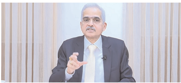
शहरी खपत मजबूत बनी हुई है और पूंजीगत व्यय में वृद्धि के कारण निवेश चक्र रफ्तार पकड़ रहा है। निजी निवेश में भी सुधार के संकेत दिख रहे हैं। उन्होंने कहा कि रबी बुवाई में सुधार, विनिर्माण क्षेत्र के लाभ में सतत वृद्धि और सेवा क्षेत्र में अंतर्निहित मजबूती से 2024-25 में आर्थिक गतिविधियों को समर्थन मिलेगा। वित्त वर्ष 2024-25 के लिए सकल घरेलू

दक्षिण भारत राष्ट्रमत dakshinbharat.com मुंबई/भाषा। भारतीय रिजर्व बैंक (आरबीआई) का अनुमान है कि परिवारों का उपभोग बढ़ने और निजी निवेश में सुधार से अगले वित्त वर्ष 2024-25 में सकल घरेलू उत्पाद (जीडीपी) की वृद्धि दर सात प्रतिशत रहेगी। हालांकि, यह राष्ट्रीय सांख्यिकी कार्यालय (एनएसओ) के चालू वित्त वर्ष (2023-24) के 7.3 प्रतिशत के अनुमान से कम है। भारतीय अर्थव्यवस्था 2022-23 में 7.2 प्रतिशत की दर से बढ़ी थी। आरबीआई गवर्नर शक्तिमंत दास ने बृहस्पतिवार को द्विमासिक मॉड्रिक नीति की घोषणा करते हुए कहा कि ग्रामीण मांग में तेजी जारी है, शहरी खपत मजबूत बनी हुई है और पूंजीगत व्यय में वृद्धि के कारण निवेश चक्र रफ्तार पकड़ रहा है। निजी निवेश में भी सुधार के संकेत दिख रहे हैं। उन्होंने कहा कि रबी बुवाई में सुधार, विनिर्माण क्षेत्र के लाभ में सतत वृद्धि और सेवा क्षेत्र में अंतर्निहित मजबूती से 2024-25 में आर्थिक गतिविधियों को समर्थन मिलेगा। वित्त वर्ष 2024-25 के लिए सकल घरेलू उत्पाद (जीडीपी) की वृद्धि दर सात प्रतिशत रहेगी। हालांकि, इसके साथ ही केंद्रीय बैंक ने कहा कि भूराजनीतिक तनाव, अंतरराष्ट्रीय बाजारों में उतार-चढ़ाव वृद्धि परिदृश्य के लिए जोखिम है। दास ने कहा, वैश्विक वृद्धि 2024 में स्थिर बनी रहेगी की उम्मीद है। पिछले काफी संकट वाले साल में इसने हारान करने वाला जुझारू प्रदर्शन किया है। मुद्रास्फीति कई दशक के सुधार की उम्मीद है। इसके अलावा