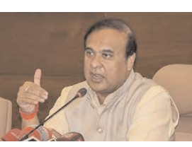
तैयार कर सकें। असम सरकार ने पंजीकृत निर्माण श्रमिकों के कौशल को बढ़ाने, निर्माण उद्योग में प्रशिक्षित संसाधनों को संरक्षित करने और प्रशिक्षुओं को भविष्य के कौशल और आधुनिक तकनीक से जोड़ने के उद्देश्य से केंद्र स्थापित करने के लिए लारिन एडुट्रो (एलएंडटी) के साथ हाथ मिलाया है। शर्मा ने युवाओं से खुद को सौर प्रौद्योगिकी में प्रशिक्षित करने की भी अपील की ताकि क्षेत्र में रोजगार और कमाई के अवसर उनके हाथ से न निकल जाएं। अभियांत्रिकी कंपनी इस सुविधा केंद्र में 90 दिवसीय प्रशिक्षण पूरा करने वालों को रोजगार के अवसर प्रदान करेगी।

दक्षिण भारत राष्ट्रमत dakshinbharat.com गुवाहाटी/भाषा। मुख्यमंत्री हिमंत विश्व शर्मा ने कहा कि असम में जारी निर्माण गतिविधियों के कारण राज्य में बड़े पैमाने पर रोजगार का सृजन हुआ है। उन्होंने कहा कि अपेक्षित कौशल की कमी के कारण रोजगार की तलाश में युवा दूसरे राज्यों की ओर पलायन कर रहे हैं और यहां कम वेतन वाली नौकरियां कर रहे हैं। मुख्यमंत्री ने बुधवार को धेमाजी जिले के गोगामुख में एक कौशल प्रशिक्षण केंद्र के उद्घाटन के अवसर पर यह बात कही। उन्होंने राज्य के युवाओं के नए जमाने और आधुनिक तकनीकी कार्यों में प्रशिक्षित होने की आवश्यकता पर जोर दिया, ताकि वे देश-विदेश में उपलब्ध लाभकारी नौकरी के अवसरों के लिए खुद को तैयार कर सकें। असम सरकार ने पंजीकृत निर्माण श्रमिकों के कौशल को बढ़ाने, निर्माण उद्योग में प्रशिक्षित संसाधनों को संरक्षित करने और प्रशिक्षुओं को भविष्य के कौशल और आधुनिक तकनीक से जोड़ने के उद्देश्य से केंद्र स्थापित करने के लिए लारिन एडुट्रो (एलएंडटी) के साथ हाथ मिलाया है। शर्मा ने युवाओं से खुद को सौर प्रौद्योगिकी में प्रशिक्षित करने की भी अपील की ताकि क्षेत्र में रोजगार और कमाई के अवसर उनके हाथ से न निकल जाएं। अभियांत्रिकी कंपनी इस सुविधा केंद्र में 90 दिवसीय प्रशिक्षण पूरा करने वालों को रोजगार के अवसर प्रदान करेगी।