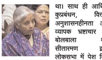
वित्त मंत्री निर्मला सीतारमण ने बृहस्पतिवार को भारतीय अर्थव्यवस्था पर एक 'श्वेत पत्र' संसद में पेश किया।

दक्षिण भारत राष्ट्रमत dakshinbharat.com नई दिल्ली/भाषा। वित्त मंत्री निर्मला सीतारमण ने बृहस्पतिवार को भारतीय अर्थव्यवस्था पर एक 'श्वेत पत्र' संसद में पेश किया। श्वेत पत्र में कहा गया है कि राष्ट्रीय जनतांत्रिक गठबंधन (राजग) सरकार ने संयुक्त प्रगतिशील गठबंधन (संग्रम) सरकार से विरासत में मिली चुनौतियों पर पिछले 10 वर्षों में सफलतापूर्वक काबू पाया है। साथ ही भारत को उच्च वृद्धि के रास्ते पर लाने के लिए 'कड़े फैसले' किए हैं। कुल 59 पृष्ठ के 'भारतीय अर्थव्यवस्था पर श्वेत पत्र' में कहा गया है कि जब 2014 में नरेन्द्र मोदी सरकार ने सत्ता संभाली, तो अर्थव्यवस्था नाजुक स्थिति में थी, सार्वजनिक वित्त खराब स्थिति में था। साथ ही आर्थिक कुप्रबंधन, वित्तीय अनुशासनहीनता और व्यापक भ्रष्टाचार का बोलबाला था। सीतारमण द्वारा लोकसभा में पेश किए गए दस्तावेज में कहा गया है, यह संकटपूर्ण स्थिति थी। अर्थव्यवस्था को चरण दर चरण सुधारने और शासन प्रणालियों को व्यवस्थित करने की जिम्मेदारी बहुत बड़ी थी। श्वेत पत्र के मुताबिक, संग्रम सरकार आर्थिक गतिविधियों को सुचारु रूप देने में बुरी तरह विफल रही। इसके बजाय संग्रम सरकार ने बाधाएं पैदा कीं, जिससे अर्थव्यवस्था पीछे रह गई। इस दस्तावेज में साथ कहा कि 2014 में राजग सरकार को विरासत में बेहद कमजोर अर्थव्यवस्था मिली थी। श्वेत पत्र में कहा गया कि मोदी सरकार ने व्यापक आर्थिक बेहदरी के लिए कठोर निर्णय लेने की जरूरत को समझा।