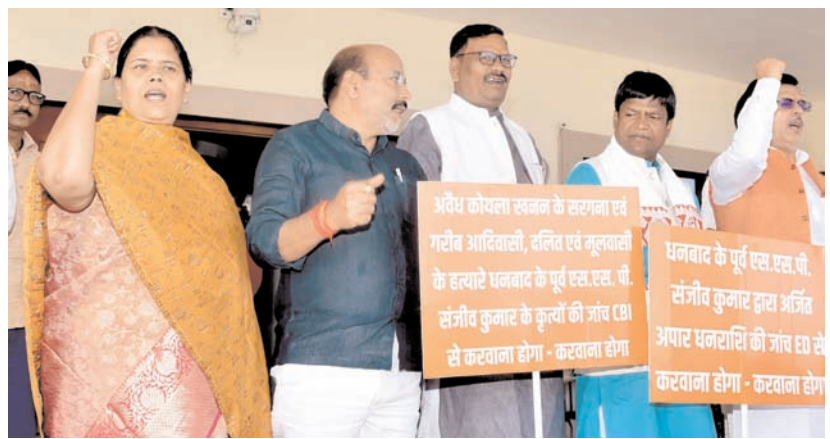
रांची में झारखंड विधानसभा में बुधवार को चल रहे बजट सत्र के दौरान भाजपा विधायकों ने अपनी विभिन्न मांगों को लेकर झारखंड सरकार के खिलाफ विरोध प्रदर्शन किया।