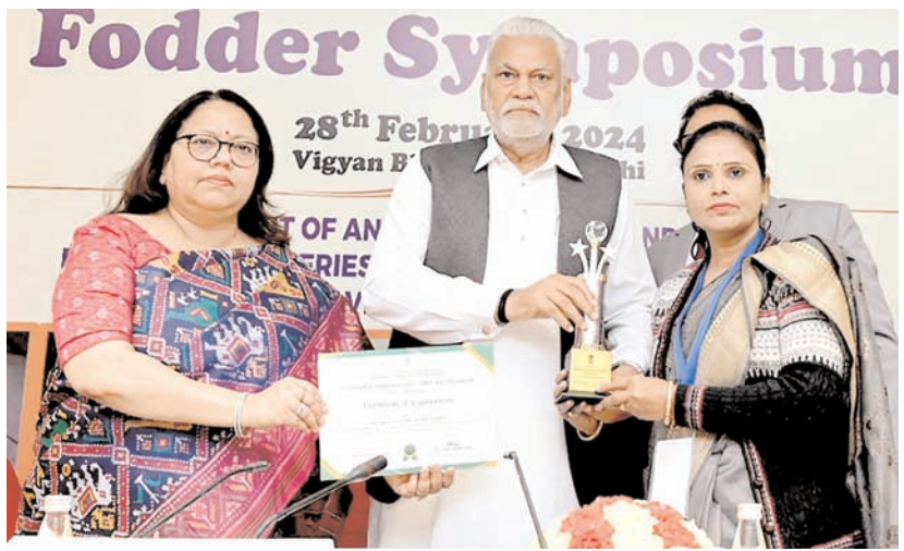
नई दिल्ली में केंद्रीय मत्स्य पालन, पशुपालन और डेयरी मंत्री, परषतोत्तम रूपाला बुधवार को नई दिल्ली के विज्ञान भवन में चारा संगोष्ठी कार्यक्रम में भाग लेते हुए।