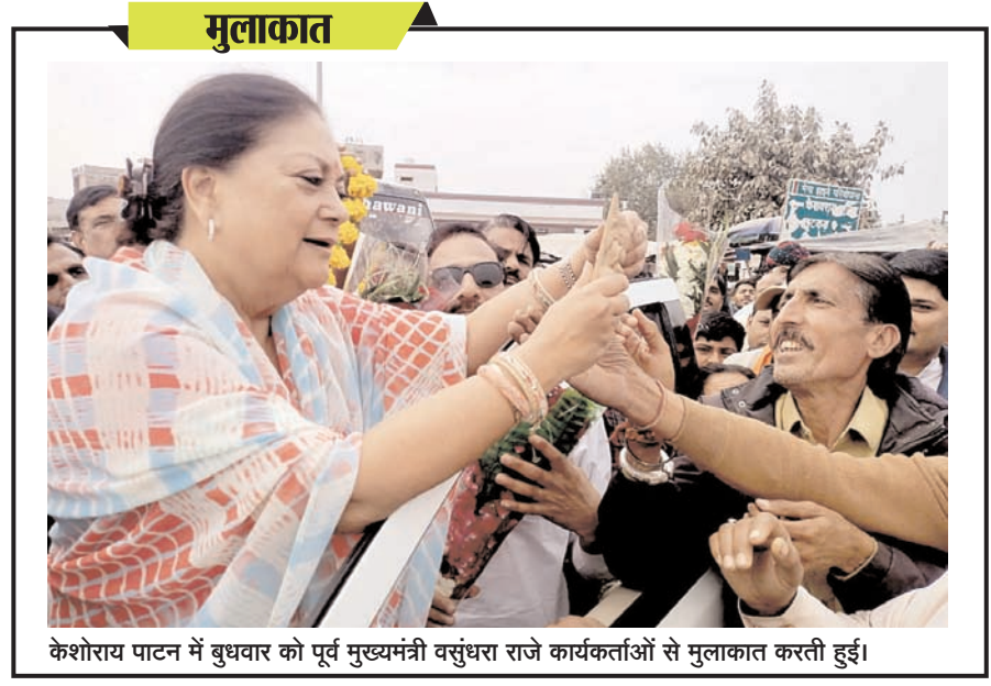
केशोराय पाटन में बुधवार को पूर्व मुख्यमंत्री वसुंधरा राजे कार्यकर्ताओं से मुलाकात करती हुईं।

जयपुर। कांग्रेस नेता सचिन पायलट ने भारतीय जनता पार्टी (भाजपा) पर निशाना साधते हुए बुधवार को आरोप लगाया कि सत्तारूढ़ दल ने हर मुद्दे पर वादाखिलाफी की है। इसके साथ ही पायलट ने उम्मीद जताई कि कांग्रेस हिमाचल प्रदेश के मामले को जल्द सुलझा लेगी। उन्होंने केंद्र की भाजपा सरकार पर निशाना साधते हुए सीकर में मीडिया से कहा कि देश में पिछले 10 साल की स्थिति और भाजपा का 10 साल का रिपोर्ट कार्ड देखिए। उन्होंने दावा किया कि हर मुद्दे पर इस सरकार ने वादाखिलाफी की है, विशेष तौर पर किसानों और नौजवानों के साथ। पायलट ने कहा, हर मोर्चे पर सिर्फ प्रचार हो रहा है, लेकिन धरातल पर महंगाई, बेरोजगारी के मामले में वो (केंद्र सरकार) अपने आपको कामयाब नहीं कर पाये। हिमाचल प्रदेश के राजनीतिक घटनाक्रम पर उन्होंने कहा, हमारी पार्टी ने हिमाचल में पर्यवेक्षक नियुक्त किए हैं। वे सबसे बात करेंगे और उम्मीद है बहुत जल्द मामले को सुलझा लिया जाएगा। पूर्व उपमुख्यमंत्री ने दावा किया कि विपक्षी दलों का गठबंधन 'इंडिया' मजबूत है। पायलट ने कहा, चुनाव से पहले बहुत से लोग आते-जाते हैं। यह लगभग हर चुनाव के पहले होता है लेकिन यह चुनाव (भाजपा नीत) राजग बनाम 'इंडिया' गठबंधन का है। हमारा गठबंधन मजबूत है।