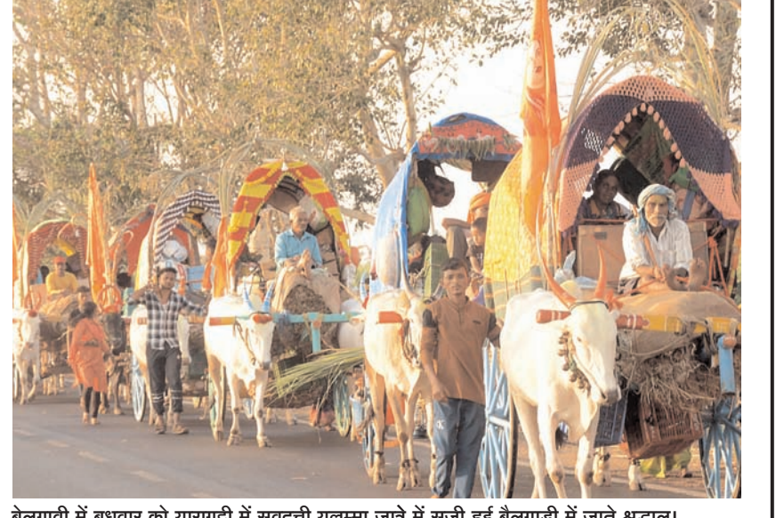
बेलगावी में बुधवार को यारगुडी में सवदती यलम्मा जात्रे में सजी हुई बेलगाडी में जाते श्रद्धालु।