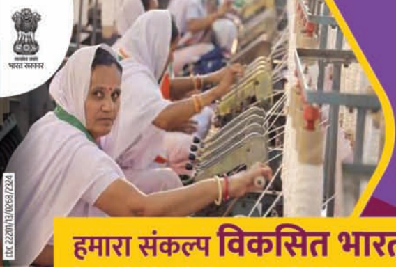
हमारा संकल्प विकसित भारत

7 निर्देशक नीरज पांडे की अगली फिल्म में अभिनय करेगी सैयामी खेर