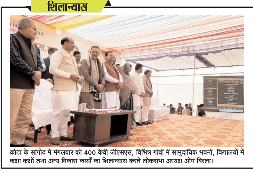
कोटा के सांगोद में मंगलवार को 400 केपी जीएसएस, विभिन्न गांवों में सामुदायिक भवनों, विद्यालयों में कक्षा कक्षां तथा अन्य विकास कार्यों का शिलान्यास करते लोकसभा अध्यक्ष ओम बिरला।