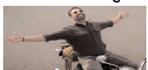
सोशल मीडिया अकाउंट पर 'सरफिरा' का वीडियो शेयर किया है। इसके साथ ही उन्होंने रिलीज डेट की जानकारी देते हुए कैप्शन में लिखा, इतना बड़ा सपना देखों, वो तुम्हें पागल बुलाए! 'सरफिरा' सिनेमाघरों में 12 जुलाई, 2024 को रिलीज हो रही है।

बॉलीवुड के जानेमाने अभिनेता अक्षय कुमार फिल्म 'सरफिरा' में काम करते नजर आएंगे। अक्षय कुमार की आने वाली फिल्म सरफिरा दक्षिण भारतीय फिल्म सोरारई पोटरु का हिंदी रीमेक है। इस फिल्म में तमिल स्टार सूर्य ने लीड रोल निभाया था। अक्षय कुमार ने सोशल मीडिया पर फिल्म 'सरफिरा' का अनावसंभत वीडियो जारी किया है। अक्षय कुमार ने अपने आधिकारिक