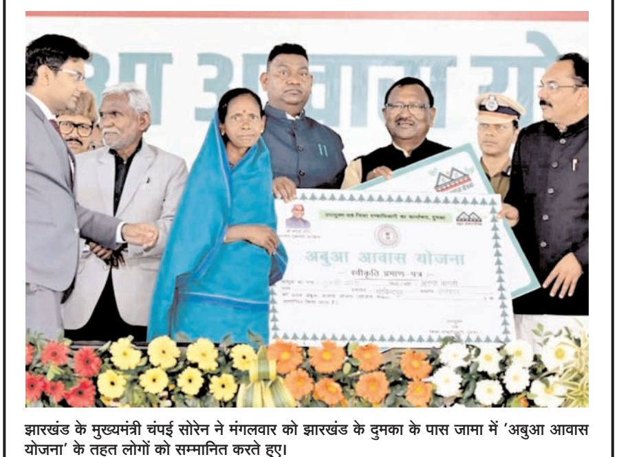
झारखंड के मुख्यमंत्री चंपई सोरेन ने मंगलवार को झारखंड के दुमका के पास जामा में 'अबुआ आवास योजना' के तहत लोगों को सम्मानित करते हुए।