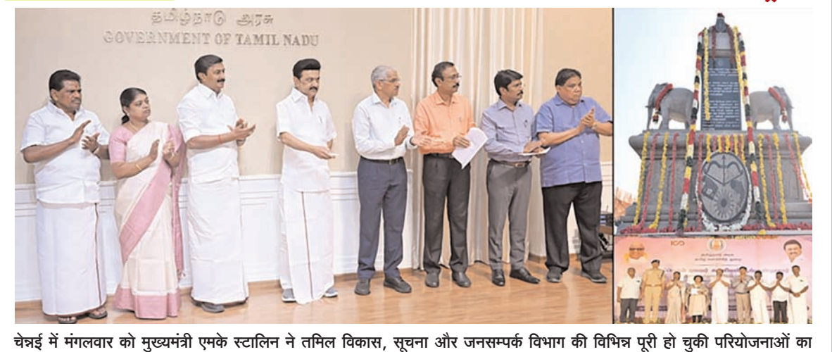
चेन्नई में मंगलवार को मुख्यमंत्री एमके स्टालिन ने तमिल विकास, सूचना और जनसम्पर्क विभाग की विभिन्न पूरी हो चुकी परियोजनाओं का उद्घाटन वीडियो कांफ्रेंसिंग के माध्यम से किया एवं अनेक परियोजनाओं की आधारशिला रखी।