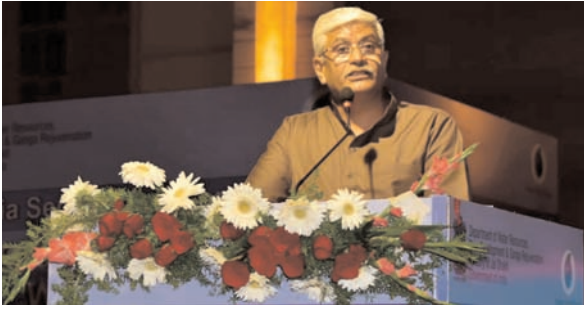
दक्षिण भारत राष्ट्रमत dakshinbharat.com

चेन्नई। देश की जल सुरक्षा को मजबूत करने के मुख्य उद्देश्य से 23 और 24 जनवरी, 2024 को महाबलीपुरम में दो दिवसीय 'जल विजन 2047-वे अहेड' पर अखिल भारतीय सचिव सम्मेलन का आयोजन किया गया है। इस सम्मेलन में 32 राज्य और केंद्र शासित प्रदेश, 30 सचिव और 300 से अधिक प्रतिनिधि भाग ले रहे हैं, जो 5 व 6 जनवरी को भोपाल में आयोजित जल पर प्रथम अखिल भारतीय वार्षिक राज्य सचिवों के सम्मेलन की 22 सिफारिशों पर अपनी सर्वोत्तम