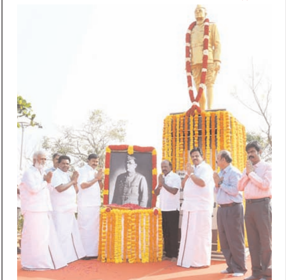
चेन्नई में मंगलवार को नेताजी सुभाषचन्द्र बोस की 128वीं जयंती के मौके पर उनके चित्र पर पुष्पांजलि अर्पित करते हुए मंत्रीगण।