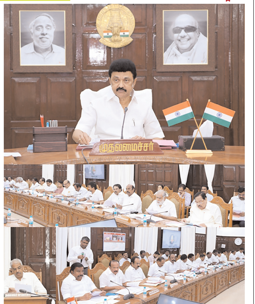
चेन्नई में मंगलवार को मुख्यमंत्री एमके स्टालिन ने सचिवालय में अपने कैबिनेट मंत्रिमंडल के साथ बैठक की अध्यक्षता की।