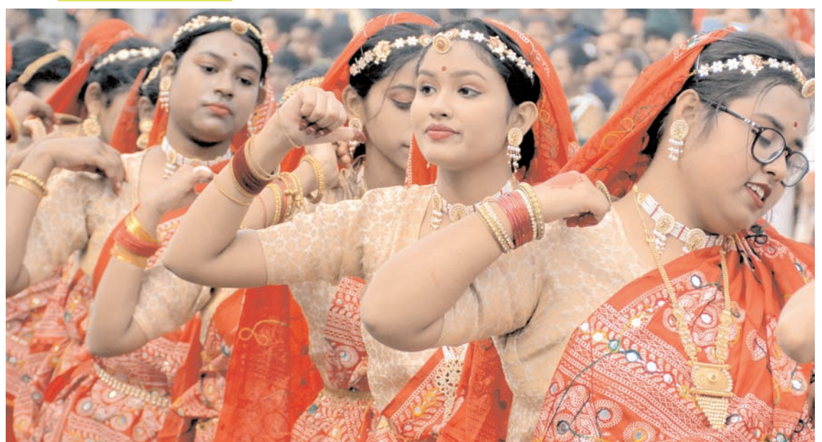
अगरतला में नेताजी सुभाष विद्यानिकेतन के छात्रों ने नेताजी सुभाष चंद्र बोस की 128वीं जयंती के उपलक्ष्य में प्रदर्शन किया।