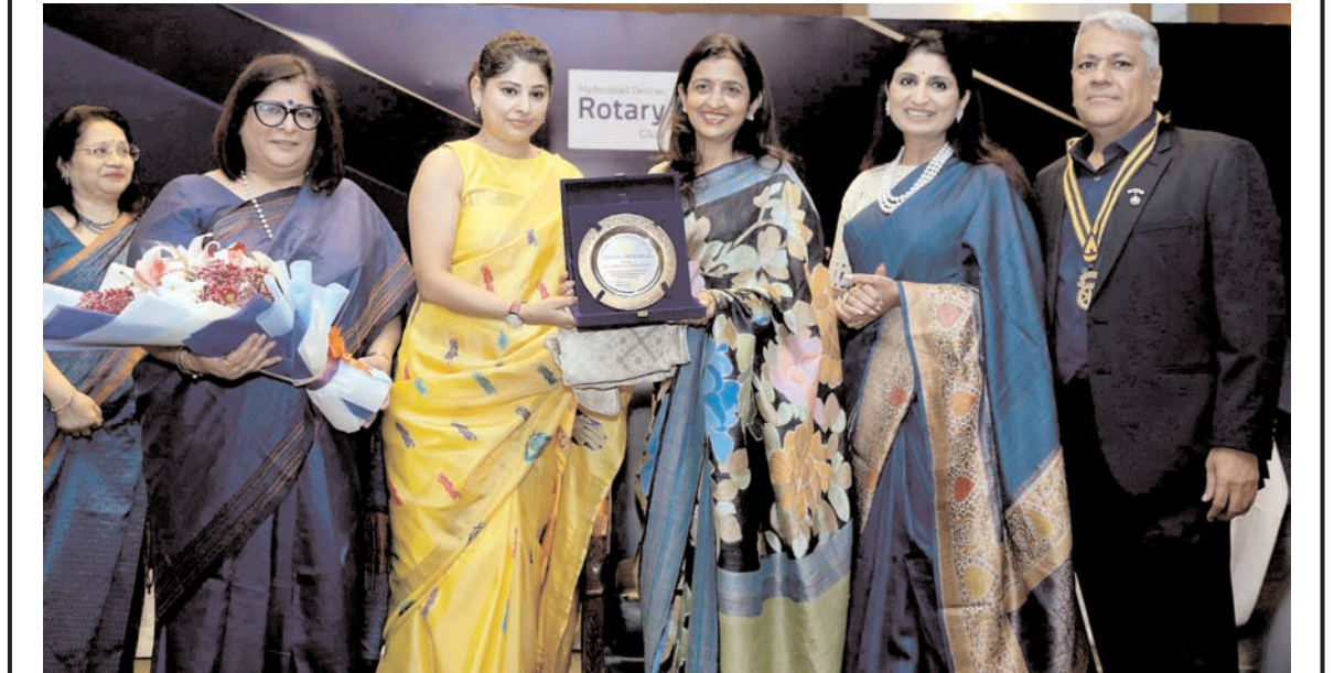
हैदराबाद में गुरुवार को हैदराबाद में सामाजिक कार्यों में उल्लेखनीय योगदान देने वाली महिलाओं के लिए व्यावसायिक सेवा उत्कृष्टता पुरस्कार (2023-24) में विजिता महिलाओं को पुरस्कार प्रदान करते हुए।