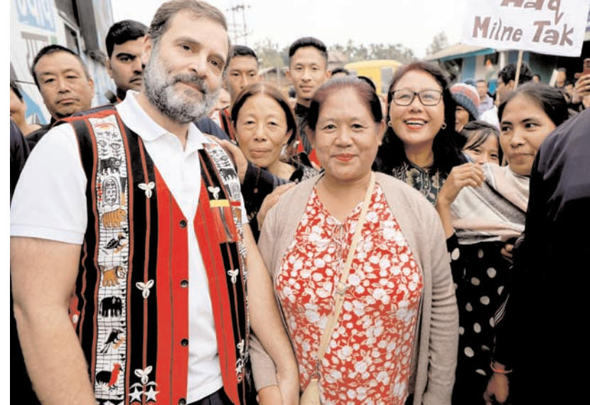
कांग्रेस नेता राहुल गांधी गुरुवार को नागालैंड के मोकोकुचुंग जिले में भारत जोड़ो न्याय यात्रा में समर्थकों के साथ।