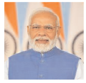
स्थान कहा जाता है जहां से राम सेतु का निर्माण किया गया था। राम मंदिर के प्राण प्रतिष्ठा समारोह से पहले एक दिन के प्रधानमंत्री लगातार मंदिरों में जा रहे हैं। पिछले दिनों उन्होंने आंध्र प्रदेश के लेपाक्षी स्थित वीरभद्र और केरल के गुरुवायूर में विश्वविख्यात भगवान कृष्ण मंदिर में पूजा अर्चना की थी। इससे पहले, उन्होंने नासिक के भी एक मंदिर का दौरा किया था। इस दौरान उन्होंने विभिन्न भाषाओं जैसे मराठी, मलयालम और तेलुगु में रामायण मंत्रोच्चारण में भाग लिया। पीएमओ ने कहा कि अरुलमिगु रामनाथस्वामी मंदिर में वह एक श्री रामायण पर्याण कार्यक्रम में भाग लेंगे। इस कार्यक्रम में आठ अलग-अलग पारंपरिक मंडली संस्कृत, अवधी, कश्मीरी, गुरुमुखी, असमिया, बांग्ला, मैथिली और गुजराती रामकथा (अयोध्या में श्री राम की वापसी के प्रकरण का वर्णन करते हुए) का पाठ करेंगी। पीएमओ ने कहा, यह भारतीय सांस्कृतिक लोकाचार और जुड़ाव के अनुरूप है, जो 'एक भारत श्रेष्ठ भारत' के मूल में है। श्री अरुलमिगु रामनाथस्वामी मंदिर में प्रधानमंत्री भजन संध्या में भी भाग लेंगे, जहां शाम को मंदिर परिसर में कई भक्ति गीत गाए जाएंगे।

दक्षिण भारत राष्ट्रमत dakshinbharat.com चेन्नई/नई दिल्ली। अयोध्या में राम मंदिर के प्राण प्रतिष्ठा समारोह से पहले प्रधानमंत्री नरेन्द्र मोदी 20 और 21 जनवरी को तिरुचिरापल्ली के प्रसिद्ध श्री रंगनाथस्वामी मंदिर सहित तमिलनाडु के अन्य महत्वपूर्ण मंदिरों का दौरा करेंगे। प्रधानमंत्री कार्यालय (पीएमओ) ने बृहस्पतिवार को यह जानकारी दी। उसके मुताबिक प्रधानमंत्री 20 जनवरी को सुबह लगभग 11 बजे रंगनाथस्वामी मंदिर में एक कार्यक्रम में भाग लेंगे। प्रधानमंत्री के श्लोकों का पाठ करने वाले विभिन्न विद्वानों को भी सुनेंगे। इसके बाद प्रधानमंत्री दोपहर करीब दो बजे रामेश्वरम पहुंचेंगे और श्री अरुलमिगु रामनाथस्वामी मंदिर में दर्शन और पूजा करेंगे। अगले दिन 21 जनवरी को वह धनुषकोडी के कोटांदरामास्वामी मंदिर में दर्शन और पूजा करेंगे। पीएमओ ने कहा कि उसके मुताबिक प्रधानमंत्री अरिचल मुनाई भी जाएंगे, जिसे वह