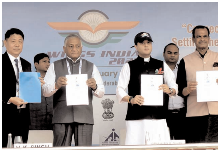
हैदराबाद में गुरुवार को केन्द्रीय नागरिक उड्डयन और इस्पात मंत्री, ज्योतिरादित्य एम सिंधिया, नागरिक उड्डयन राज्य मंत्री, जनरल वीके सिंह और अन्य ने बेगम्पेट एयर पोर्ट पर विंस इंडिया 2024 के उद्घाटन के दौरान उड़ान 5.3 योजना का विमोचन करते हुए।