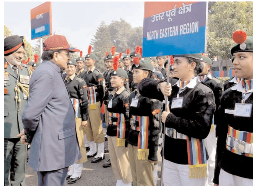
नई दिल्ली में रक्षा और पर्यटन राज्य मंत्री अजय भट्ट ने दिल्ली कैंट में राष्ट्रीय केडेट कोर (एनसीसी) के गणतंत्र दिवस शिविर का दौरा करते हुए।