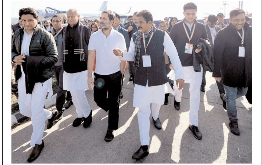
इंफाल में कांग्रेस नेता राहुल गांधी रविवार को भारत जोड़ो न्याय यात्रा के लिए इंफाल पहुंचे।