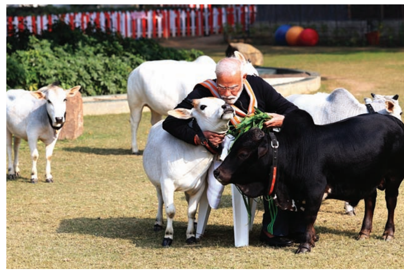
प्रधानमंत्री नरेन्द्र मोदी ने रविवार को नई दिल्ली में मकर संक्रांति के अवसर पर अपने आवास पर गायों को खाना खिलाया।