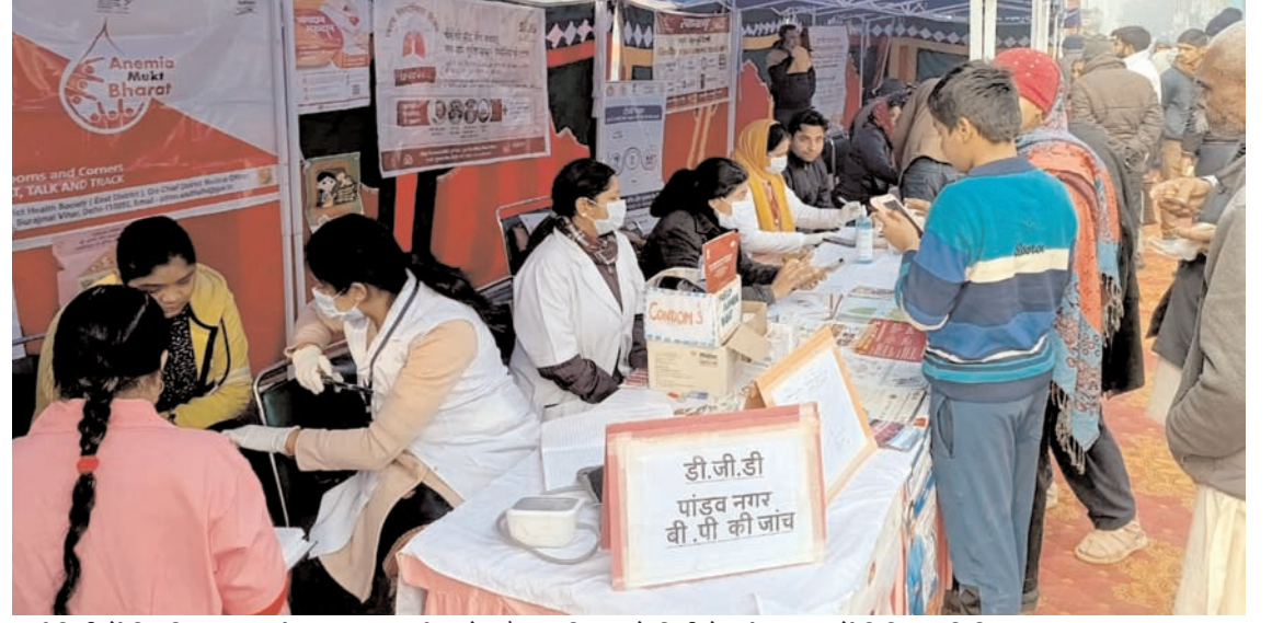
नई दिल्ली में विकसित भारत संकल्प यात्रा कार्यक्रम के दौरान रविवार को दिल्ली के पांडव नगर में चिकित्सा शिविर का एक दृश्य।