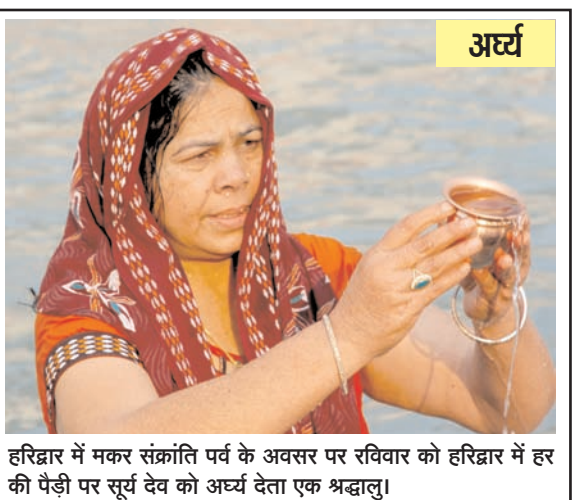
हरिद्वार में मकर संक्रांति पर्व के अवसर पर रविवार को हरिद्वार में हर की पैंडी पर सूर्य देव को अर्घ्य देता एक श्रद्धालु।

भूतपूर्व सैनिकों के लिए दो प्रतिशत आरक्षण की व्यवस्था की है और सरकारी भूमि पर उद्यम स्थापित करने के इच्छुक पूर्व सैनिकों के लिए विशेष पहल हाल ही में की है। मजूमदार ने कहा कि सरकारी क्षेत्र अकेले बड़ी संख्या में आकांक्षियों को समाहित नहीं कर सकता है और इस संदर्भ में कॉरपोरेट क्षेत्र से बहुत उम्मीद है। उन्होंने कहा, सैनिक कल्याण निदेशालय के जरिये कॉरपोरेट क्षेत्र में भर्ती का आंकड़ा बहुत उत्साहजनक नहीं है। हम महसूस करते हैं कि इस संदर्भ में और बहुत कुछ किए जाने की जरूरत है। उन्होंने बताया कि असम के सैनिक कल्याण निदेशालय में करीब 41 हजार भूतपूर्व सैनिकों ने अपना पंजीकरण कराया है, जिनमें से नौ हजार 'वीर नारी' हैं।