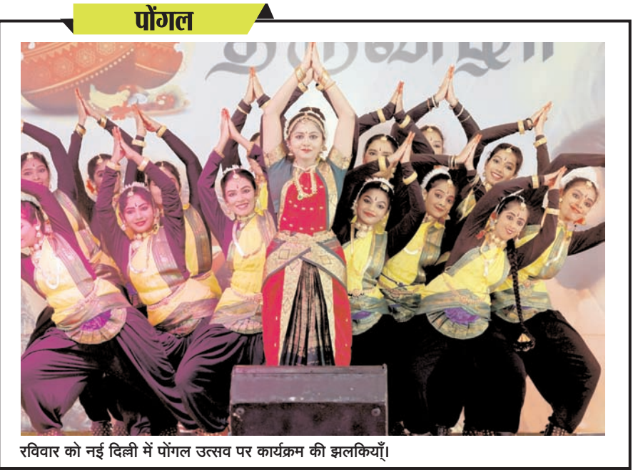
रविवार को नई दिल्ली में पोंगल उत्सव पर कार्यक्रम की झलकियाँ।