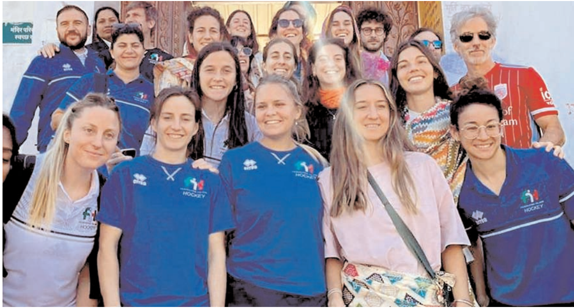
रांची में इटली की महिला हॉकी खिलाड़ी शुकुमार को रांची के जगन्नाथपुर मंदिर में भगवान बलभद्र, सुधरा और जगन्नाथ की प्रतिमा के दर्शन करने पहुंची। टीम ने एफआईएच हॉकी पेरिस ओलंपिक 2024 कालीफायर पर अपनी जीत के लिए प्रार्थना की।