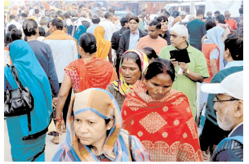
कोलकाता में शुक्रवार को भारत के विभिन्न हिस्सों से तीर्थयात्री गंगासागर मेले के लिए बाबूघाट ट्रांजिट कैंप जाते हुए।