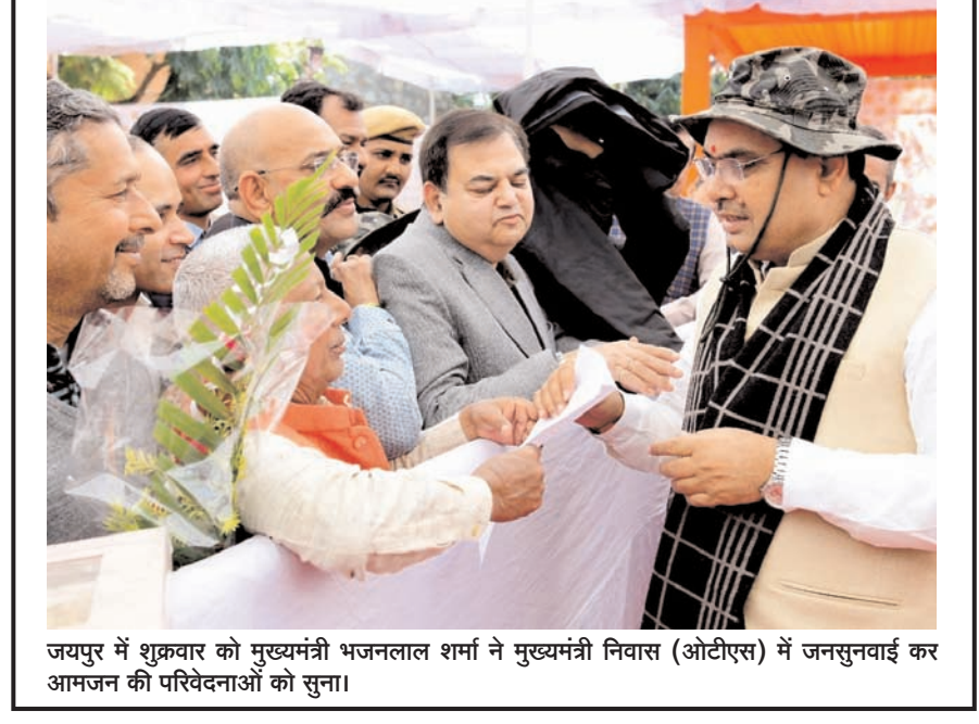
जयपुर में शुक्रवार को मुख्यमंत्री भजनलाल शर्मा ने मुख्यमंत्री निवास (ओटीएस) में जनसुनवाई कर आमजन की परिवेदनाओं को सुना।