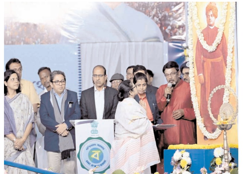
पश्चिम बंगाल की मुख्यमंत्री ममता बनर्जी मंगलवार को कोलकाता के आउटडोर घाट ट्रांजिट प्लांट पर 'गंगा सागर मेले' के उद्घाटन के दौरान।