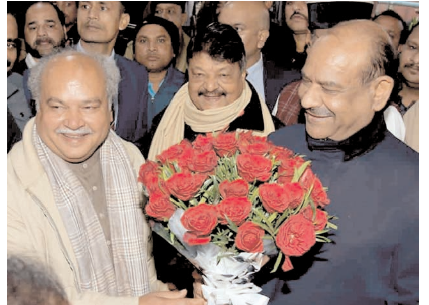
मध्य प्रदेश विधानमंडल के सदस्यों के लिए ओरिएंटेशन कार्यक्रम का उद्घाटन करने के लिए मंगलवार को भोपाल पहुंचने पर लोकसभा अध्यक्ष ओम बिरला का मध्य प्रदेश विधानसभा अध्यक्ष नरेंद्र सिंह तोमर स्वागत करते हुए।