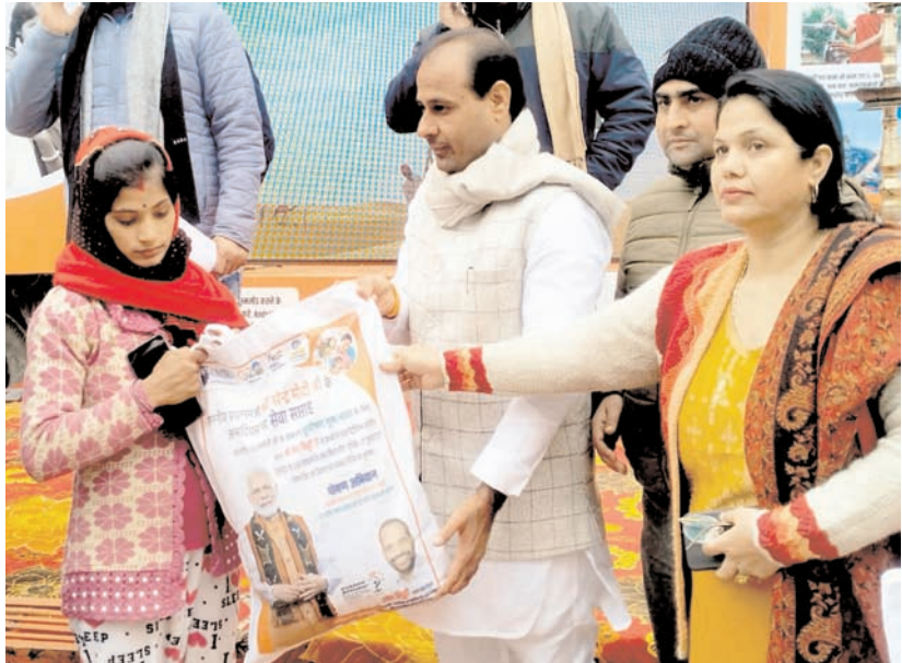
नई दिल्ली में विकसित भारत संकल्प यात्रा के दौरान मंगलवार को नई दिल्ली के महारौली में पोषण किट वितरित करते हुए।