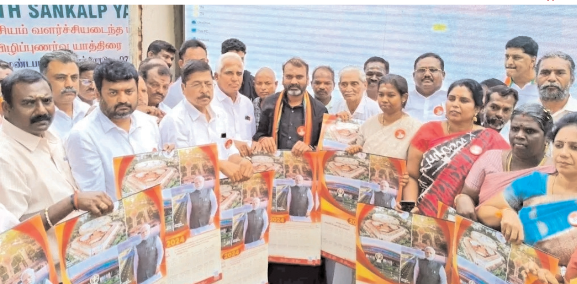
कोयंबतूर के संगनूर इलाके में रविवार को केंद्रीय मंत्री एल. मुरुगन ने भारत संकल्प यात्रा के तहत नरेंद्र मोदी सरकार द्वारा विभिन्न योजनाओं का लोकार्पण किया। उन्होंने मोदी की गारंटी का भरोसा सभी को दिलाया। साथ ही मोदी सरकार के कार्यों की प्रगति के बारे में बताया।