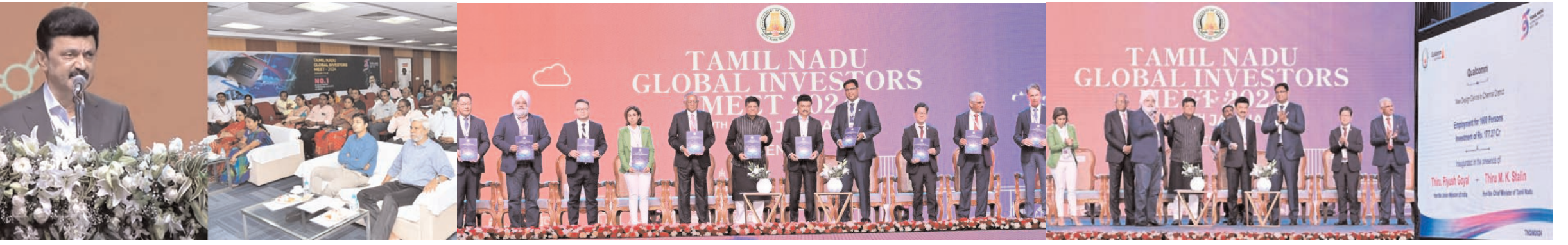
रविवार को चेन्नई में तमिलनाडु में वैश्विक निवेशक सम्मेलन (जीआईएम) के उद्घाटन समारोह के दृश्य।