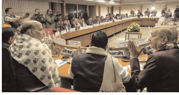
दक्षिण भारत राष्ट्रमत dakshinbharat.com

संसद के बजट सत्र से पहले सर्वदलीय बैठक संपन्न, सत्तापक्ष और विपक्ष के कई नेता शामिल हुए। नई दिल्ली/भाषा। लोकसभा चुनाव से कुछ महीने पहले, 31 जनवरी से आरंभ हो रहे संसद के बजट सत्र के मद्देनजर सरकार द्वारा बुलाई गई सर्वदलीय बैठक में मंगलवार को विभिन्न दलों के नेता शामिल हुए।