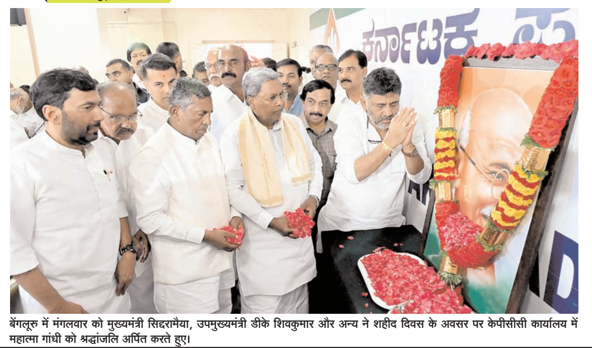
बंगलूरु में मंगलवार को मुख्यमंत्री सिद्धरामैया, उपमुख्यमंत्री डीके शिवकुमार और अन्य ने शहीद दिवस के अवसर पर केपीसीसी कार्यालय में महात्मा गांधी को श्रद्धांजलि अर्पित करते हुए।