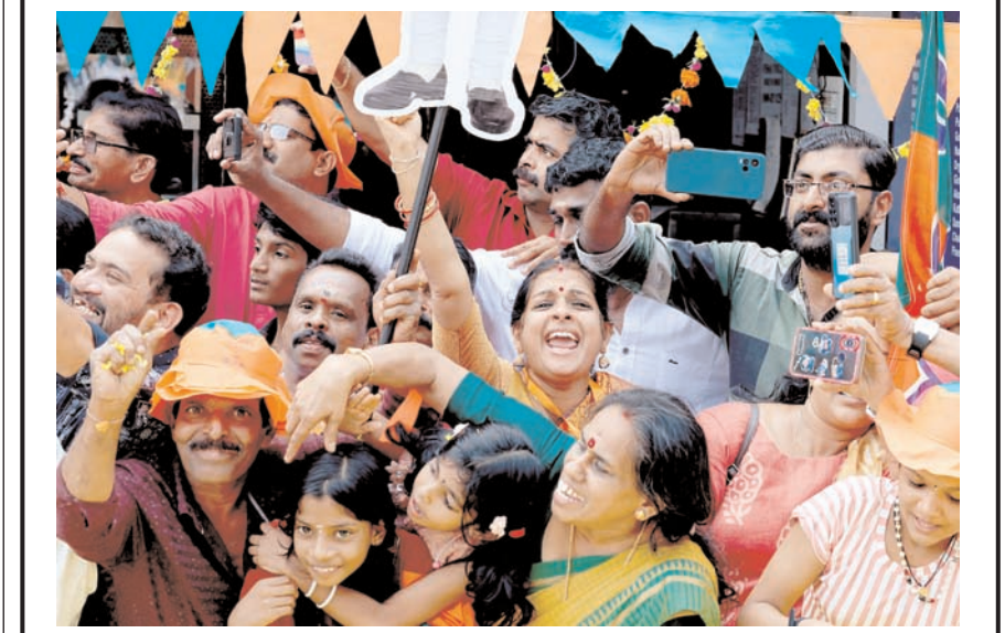
त्रिशूर में बुधवार को प्रधानमंत्री नरेंद्र मोदी का बुधवार को केरल के त्रिपुराव पहुंचने पर लोगों ने गर्मजोशी से स्वागत किया।