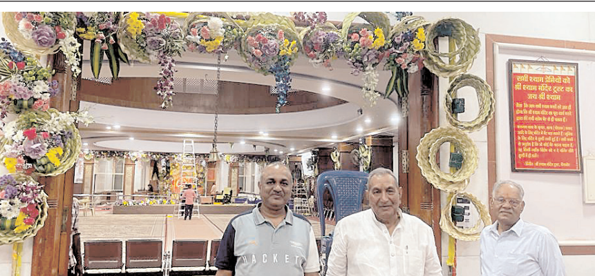
श्याम मंदिर की 11वीं वर्षगांठ की तैयारियों का एक दृश्य

2025 में प्रधानमंत्री मोदी को दावोस में पुनः आमंत्रित करेंगे। उन्होंने कहा, इसका मतलब है कि वैश्विक समुदाय प्रधानमंत्री मोदी के दोबारा सत्ता में आने को लेकर आश्वस्त है। ईरानी ने कहा, प्रधानमंत्री मोदी न केवल नीतिगत सुधारों को लेकर बल्कि यह सुनिश्चित करने को लेकर भी दुःख रहे हैं कि हमारी विकास गाथा में सामाजिक क्षेत्र को नजरअंदाज न किया जाए। मंत्री ने कहा कि समावेशी विकास एजेंडे में भारत के योगदान को दावोस में सराहा जा रहा है। उन्होंने कहा, आईटी (सूचना प्रौद्योगिकी) क्षेत्र में हमारी डिजिटल क्षमता के अलावा यह तथ्य भी दावोस में चर्चा का विषय है कि प्रधानमंत्री नरेंद्र मोदी ने दुनिया को दिखाया है कि डिजिटल लोकतंत्र कैसे काम करता है।