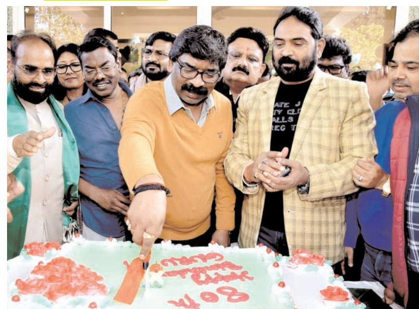
झारखंड के मुख्यमंत्री हेमंत सोरेन ने गुरुवार को रांची में अपने पिता और झारखंड मुक्ति मोर्चा (झामुमो) प्रमुख और राज्यसभा सांसद शिबू सोरेन की 80वीं जयंती समारोह के अवसर पर केक काटा।