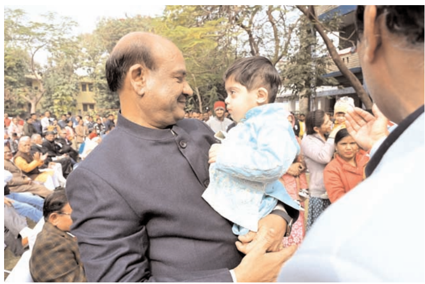
संसदीय क्षेत्र कोटा में एक कार्यक्रम में रविवार को लोकसभा अध्यक्ष ओम बिरला विद्यार्थियों बच्चों के साथ।