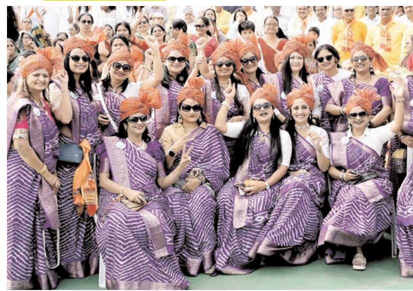
हैदराबाद में रविवार को 'जीईएम-24' -गुजराती एकता महोत्सव के शुभारंभ पर 'गुजराती गौरव यात्रा' के दौरान प्रवासी गुजराती।