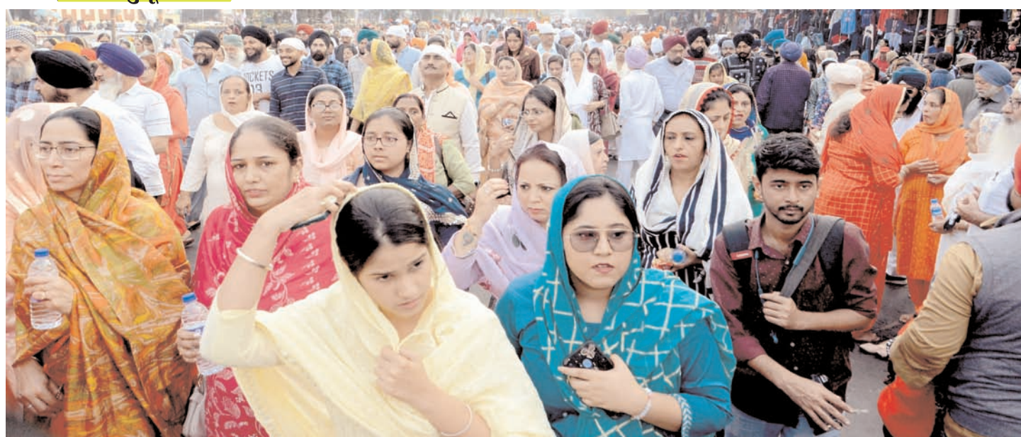
कोलकाता में सिख समुदाय के लोग रविवार को कोलकाता में श्री गुरु गोबिंद सिंह की 357वीं जयंती मनाने के लिए एक जुलूस में भाग लेते हुए।