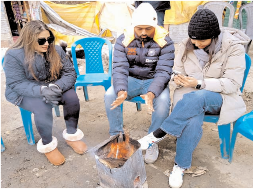
श्रीनगर में शनिवार को भीषण ठंड के बीच पर्यटक अलाव के पास बचाव करते हुए।