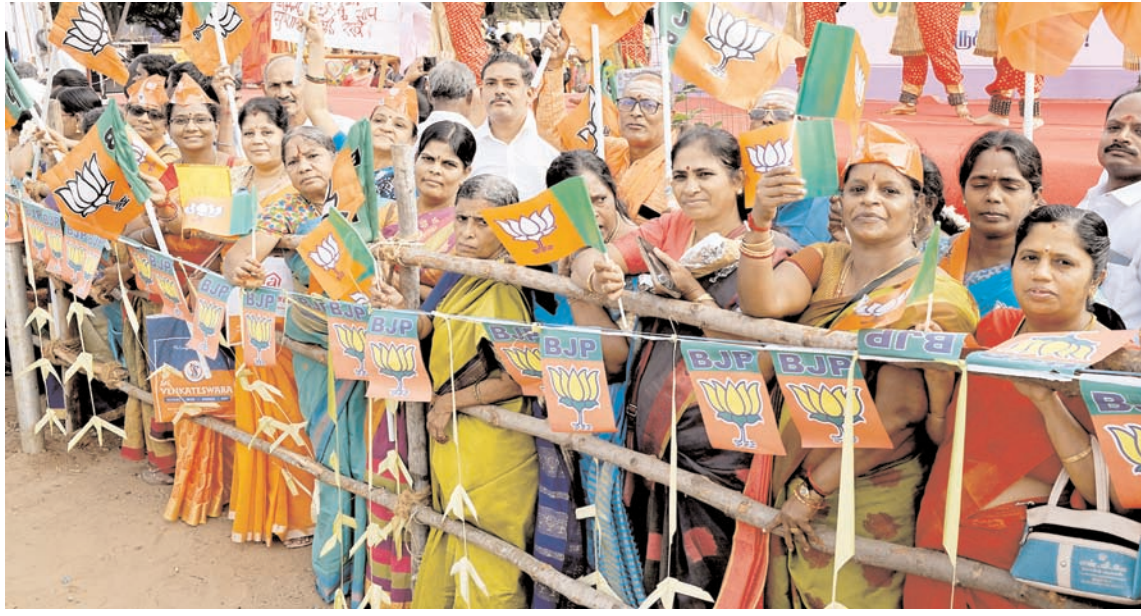
प्रधानमंत्री नरेंद्र मोदी के मंगलवार को तिरुचिरापल्ली पहुंचने पर भाजपा समर्थक उनका स्वागत करने के लिए एकत्र हुए।