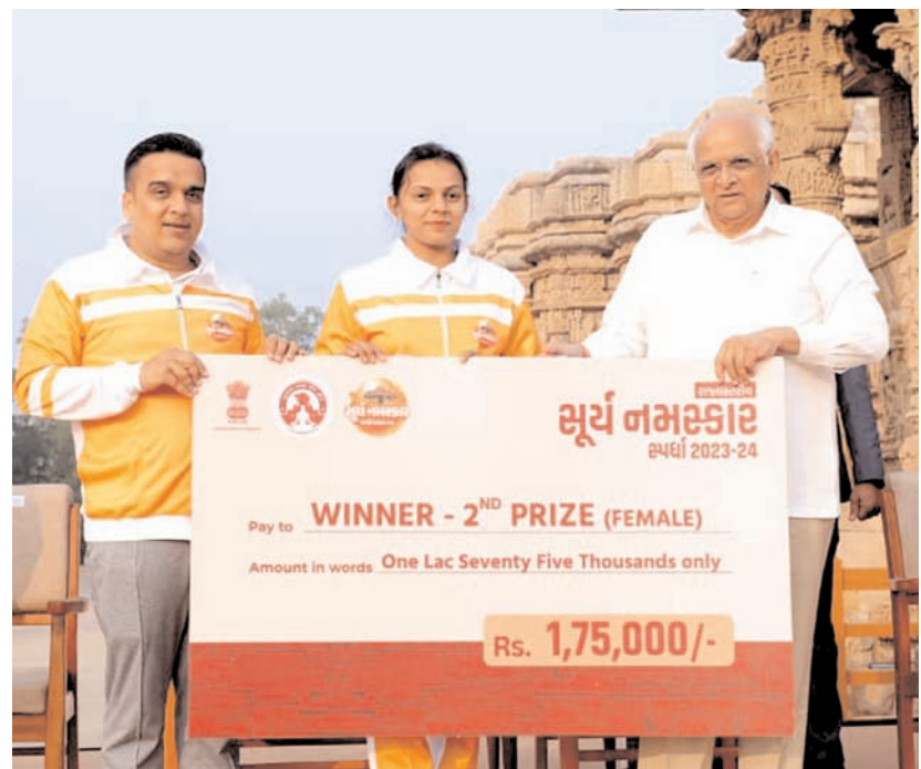
गुजरात के मुख्यमंत्री भूपेंद्र पटेल सोमवार को मोडोरा के ऐतिहासिक मोडोरा सूर्य मंदिर में योग के बारे में जागरूकता अभियान के लिए 'सूर्यनमस्कार' के प्रतिभागियों को पुरस्कार प्रदान करते हुए।