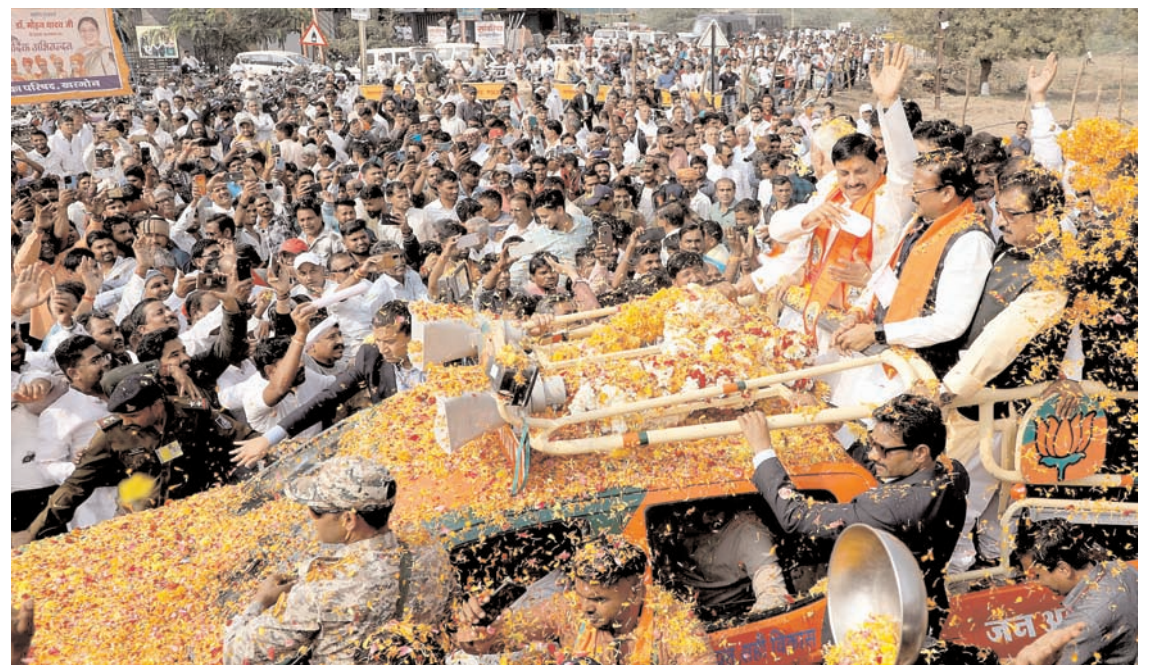
खरगोन में मध्य प्रदेश के मुख्यमंत्री डॉ. मोहन यादव सोमवार को खरगोन में एक रोड शो के दौरान लोगों का अभिवादन करते हुए।