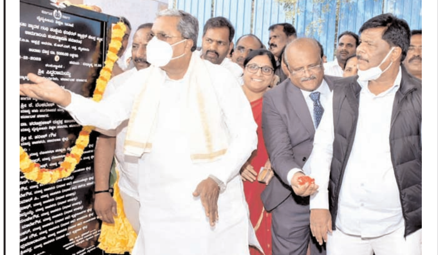
मुख्यमंत्री सिद्धरामैया और अन्य लोग शुक्रवार को मैसूरु में किदवई मेमोरियल केंसर इंस्टीट्यूट के पेरेरेल केंसर सेंटर की आधारशिला रखते हुए।