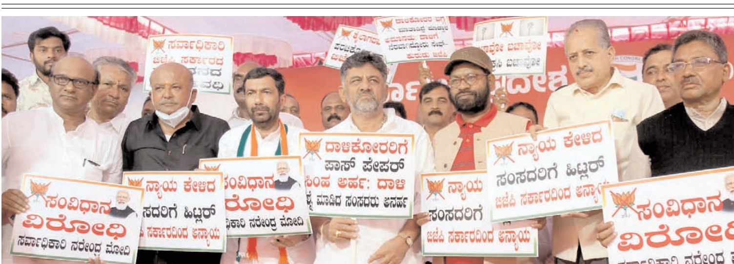
लोकसभा में सांसदों के निलंबन के खिलाफ उपमुख्यमंत्री डीके शिवकुमार के नेतृत्व में कांग्रेस नेताओं ने बेंगलूरु के फ्रीडम पार्क में विरोध प्रदर्शन करते हुए।

मैसूरु। मुख्यमंत्री सिद्धरामैया ने कहा कि धारणाओं से खबरें बनाना बंद गया है और यह एक बुरा विकास है। वे जिला पत्रकार संघ के पत्रिका भवन एवं प्रशिक्षण केंद्र का शिलान्यास करने के बाद बोल रहे थे। शिलान्यास करने के बाद बोल रहे थे। उन्होंने इस दौरान कहा कि यदि संविधान के विरोधियों से सवाल नहीं किये जायेंगे, उनके साथ सम्मानपूर्वक व्यवहार किया जायेगा तो हम मीडिया को समाज का चौथा स्तम्भ कैसे कह सकते हैं? मुख्यमंत्री ने कहा कि समाज में आज भी असमानता है, संविधान के खिलाफ बोलने वाले लोग आज भी मौजूद हैं। पत्रकारों को ऐसे लोगों से