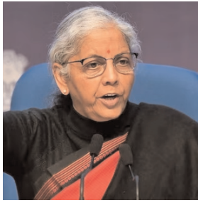
जारी कर दी है जिसका इस्तेमाल चालू वित्त वर्ष में किया जाएगा। उन्होंने कहा कि क्षेत्रीय मौसम

नई दिल्ली। केंद्रीय वित्त मंत्री निर्मला सीतारमण ने शुक्रवार को कहा कि तमिलनाडु में पिछले दिनों भारी बारिश के कारण राज्य के चार जिलों में 31 लोगों की जान चली गई। सीतारमण ने यहां संवाददाताओं से कहा कि केंद्र सरकार ने तमिलनाडु को 900 करोड़ रुपये की राशि दो किश्तों में