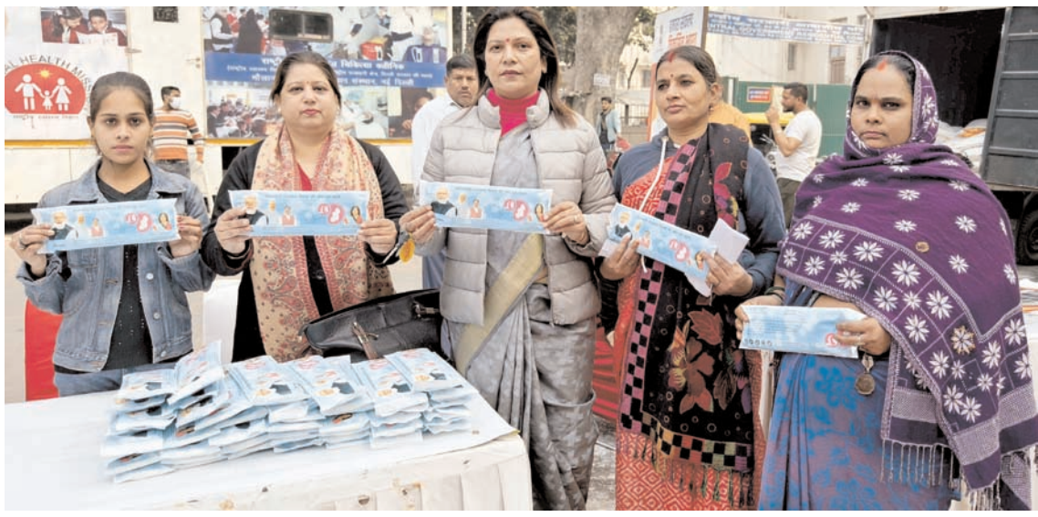
नई दिल्ली में विकसित भारत संकल्प यात्रा के दौरान शुक्रवार को आराम बाग में मुफ्त सैनिटरी नैपकिन वितरित करते हुए।