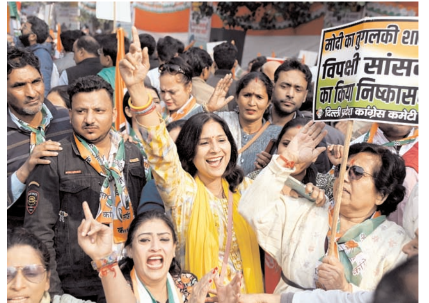
नई दिल्ली में आई.एन.डी.आई.ए. गठबंधन नेताओं ने शुक्रवार को नई दिल्ली में जंतर-मंतर पर 143 भारतीय दलों के सांसदों के निलंबन के विरोध में धरना दिया।