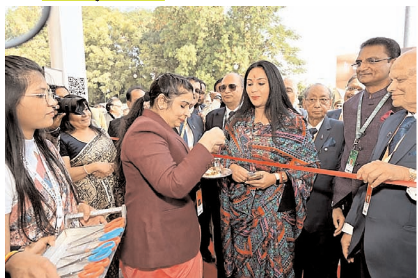
जयपुर में शुक्रवार क 'जयपुर ज्वेलरी शो' का सीतापुरा कन्वेंशन सेंटर में उद्घाटन करती उपमुख्यमंत्री दीया कुमारी।