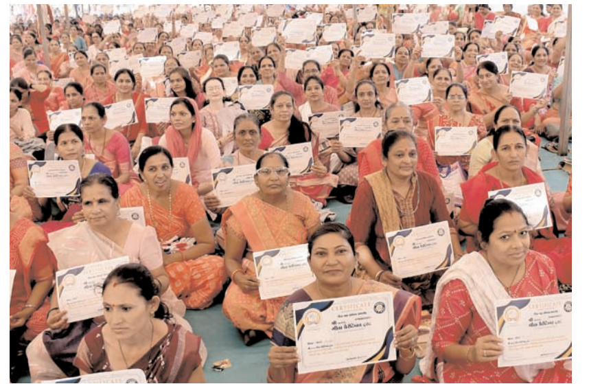
सुरत में श्रीमद्भगवत गीता चैरिटेबल ट्रस्ट ने शुक्रवार को सुरत में हिंदू अनुष्ठान भागवत गीता वर्षगांठ के अवसर पर 7000 गीता (जिन महिलाओं का नाम गीता है) को एक ही स्थान पर मिलाया।