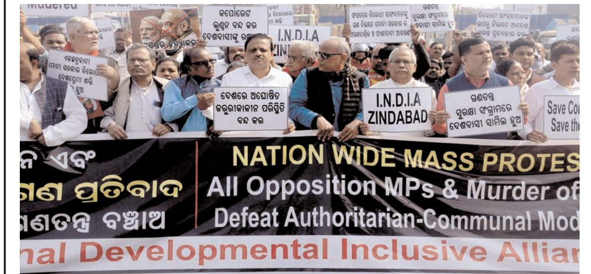
गुवाहाटी में विपक्षी दल के नेताओं ने संसद में सुरक्षा चूक और उसके बाद दोनों सदनों से 146 विपक्षी सांसदों के निष्कासन के मुद्दे पर मोदी सरकार के निकुश व्यवहार के खिलाफ शुक्रवार को गुवाहाटी में विरोध प्रदर्शन किया।