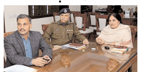
पंचायतीराज श्री रवि जैन ने विकसित भारत संकल्प यात्रा (ग्रामीण) की प्रगति के संबंध में बताया कि ग्रामीण क्षेत्रों में लोग जागरूक होकर योजनाओं का अधिकाधिक लाभ उठा सकें इसके लिए 170 आईसीसी वैन संकल्पित की जा रही है।

मुख्य सचिव शुक्रवार को सचिवालय में विकसित भारत संकल्प यात्रा को लेकर जिला कलक्टर एवं विभागीय अधिकारियों के साथ वीसी के माध्यम से बैठक को संबोधित कर रही थीं। उन्होंने कहा कि विकसित भारत संकल्प यात्रा में स्थानीय जनप्रतिनिधियों की भागीदारी सुनिश्चित की जाए। बैठक में शासन सचिव