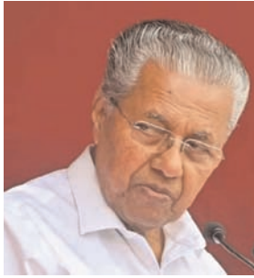
विजयन ने फेसबुक पोस्ट में कहा कि हर फिट में उपलब्ध सामग्री और उनकी प्रस्तावित मात्रा की सूची तैयार कर ली गई है। विजयन ने कहा कि चावल, नमक, चीनी, गेहूँ, सूरजमुखी का

तिरुवनंतपुरम/भाषा। केरल के मुख्यमंत्री पिनाराई विजयन ने शुक्रवार को यहां कहा कि उनकी सरकार बाढ़ प्रभावित तमिलनाडु के लिए मदद का हाथ बढ़ाएगी और बाढ़ से जूझ रहे परिवारों तक फिट के जरिये आवश्यक सामग्री उपलब्ध कराएगी।