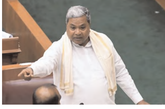
दक्षिण भारत राष्ट्रमत dakshinbharat.com

सुवर्णसौधा बेलगावी। मुख्यमंत्री सिद्धरामैया ने कहा कि राज्य में आए भीषण अकाल के चलते उन्होंने दो महीने पहले केंद्र सरकार को एक पत्र लिखा गया था, जिसमें महात्मा गांधी रोजगार गारंटी योजना के तहत सृजन की 100 मानव दिवस की वर्तमान सीमा को बढ़ाकर 150 करने की मांग की गई थी। उन्होंने सोमवार को कार्यवाही में सूखे पर चर्चा के दौरान यह बात कही। उन्होंने कहा कि राज्य के 236 तालुकों में से 223 तालुक सूखे से प्रभावित हैं। नरेगा योजना लोगों को बेरोजगार होने से बचाने में कारगर सिद्ध हुई है। रोजगार गारंटी अधिनियम सूखे की स्थिति में अतिरिक्त 50 मानव दिवस सृजन का प्रावधान करता है। इसके चलते मुख्यमंत्री सिद्धरामैया ने स्पष्ट किया कि केंद्र सरकार को पत्र लिखकर अतिरिक्त मानव दिवस सृजित करने का अनुरोध किया गया है। राज्य सरकार सूखे से निपटने के लिए पूरी तरह से तैयार है। सभी कलेक्टरों और तहसीलदारों के पास पहले से ही 800 से 900 करोड़ रुपए की धनराशि उपलब्ध है। इसका उपयोग पेयजल, चारा खरीदने सहित आवश्यक कार्यों के लिए किया जा सकता है। सरकार