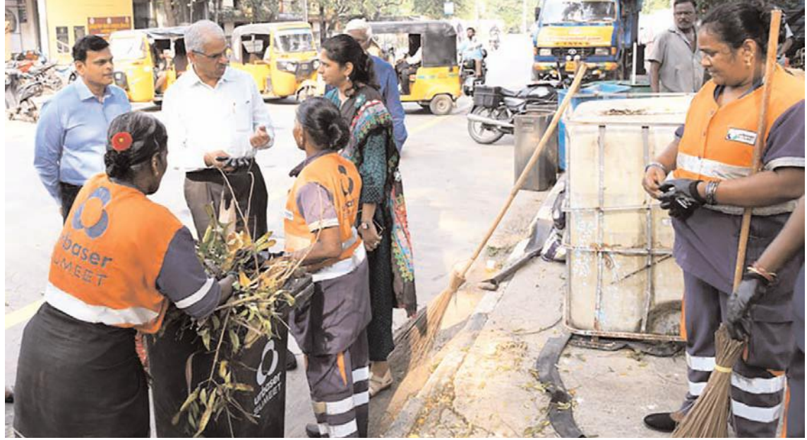
चेन्नई में सोमवार को सरकार के मुख्य सचिव ने चेन्नई में बाढ़ प्रभावित क्षेत्रों का दौरा किया। उन्होंने वहां चल रहे बचाव कार्यों और स्कूलों के कामकाज का निरीक्षण किया।