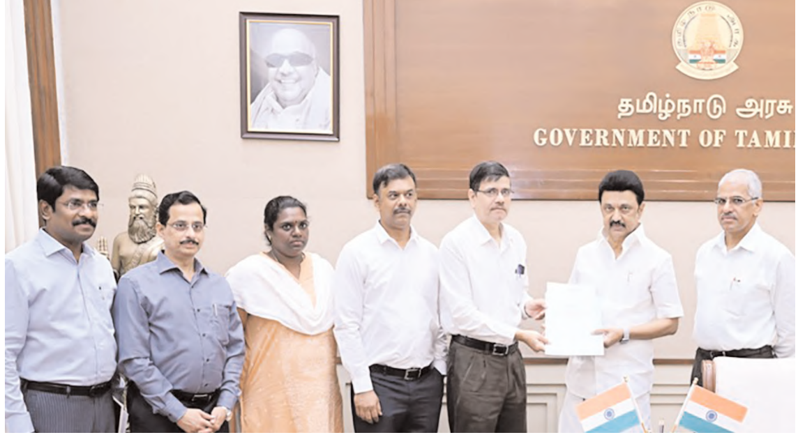
चेन्नई में सोमवार को चक्रवात मिचोंग प्रभावित क्षेत्रों में राहत और बचाव कार्यों के लिए अनेक संगठन, संस्थान और राजनैतिक दल सामने आ रहे हैं और मुख्यमंत्री जन राहत कोष में योगदान दे रहे हैं। मुख्यमंत्री एमके स्टालिन सभी के प्रति आभार व्यक्त कर सहायता कार्यों में जुटे हुए हैं।