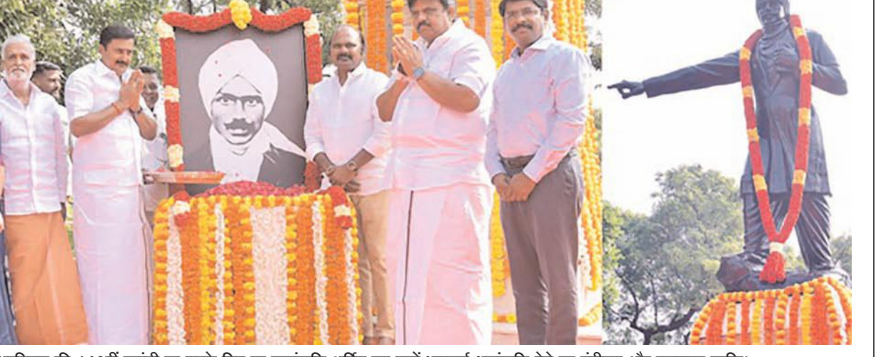
चेन्नई में सोमवार को महाकवि भरतियार की 142वीं जयंती पर उनके चित्र पर पुष्पांजलि अर्पित कर उन्हें भावपूर्ण श्रद्धांजलि देते हुए मंत्रीगण और गणमान्य व्यक्ति।