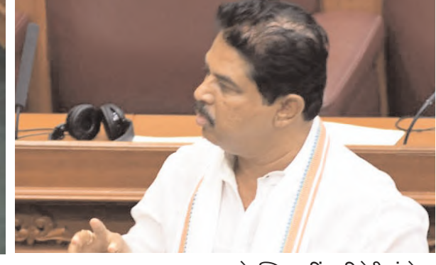
दक्षिण भारत राष्ट्रमत dakshinbharat.com

सुवर्णसौधा बेलगावी। मुख्यमंत्री सिद्धरामैया ने कहा कि राज्य में आए भीषण अकाल के चलते उन्होंने दो महीने पहले केंद्र सरकार को एक पत्र लिखा गया था, जिसमें महात्मा गांधी रोजगार गारंटी योजना के तहत सृजन की 100 मानव दिवस की वर्तमान सीमा को बढ़ाकर 150 करने की मांग की गई थी। उन्होंने सोमवार को कार्यवाही में सूखे पर चर्चा के दौरान यह बात कही। उन्होंने कहा कि राज्य के 236 तालुकों में से 223 तालुक सूखे से प्रभावित हैं। नरेगा योजना लोगों को बेरोजगार होने से बचाने में कारगर सिद्ध हुई है। रोजगार गारंटी अधिनियम सूखे की स्थिति में अतिरिक्त 50 मानव दिवस सृजन का प्रावधान करता है। इसके चलते मुख्यमंत्री सिद्धरामैया ने स्पष्ट किया कि केंद्र सरकार को पत्र लिखकर अतिरिक्त मानव दिवस सृजित करने का अनुरोध किया गया है। राज्य सरकार सूखे से निपटने के लिए पूरी तरह से तैयार है। सभी कलेक्टरों और तहसीलदारों के पास पहले से ही 800 से 900 करोड़ रुपए की धनराशि उपलब्ध है। इसका उपयोग पेयजल, चारा खरीदने सहित आवश्यक कार्यों के लिए किया जा सकता है। सरकार